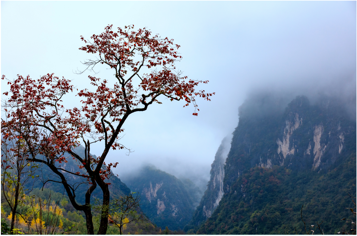
徽县嘉陵江大峡谷秋色