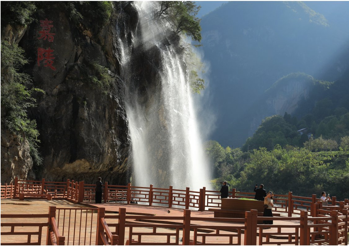
徽县嘉陵镇大峡谷瀑布