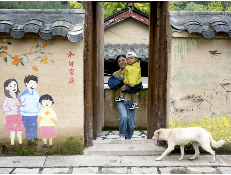
徽县嘉陵镇田河村农家