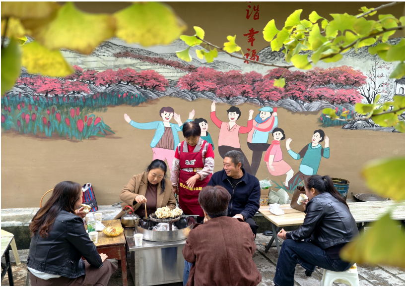
徽县嘉陵镇田河村幸福人家