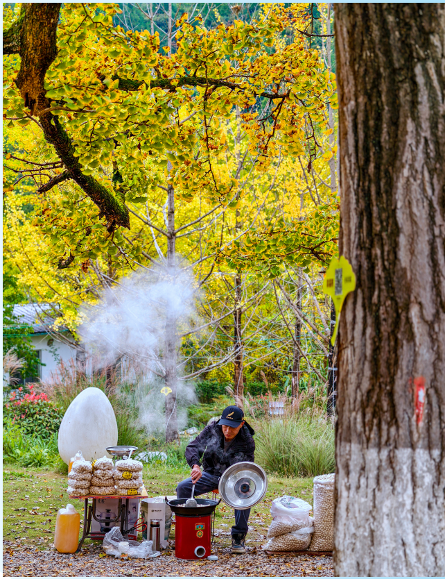
徽县嘉陵镇田河村千年古银杏