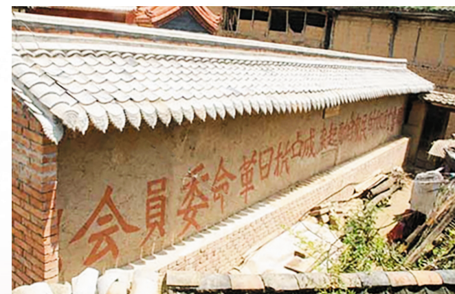
▶ 罗坝镇梁坪村梁启堂家墙壁上的标语

抗日楼位于文县碧口镇西山坡的碧口小学旁,是一幢二层木瓦结构的仿古木楼。楼高12米,屋顶四角飞檐翘角,二楼可纵览碧口镇全景。现保存完好。 抗日楼最早名叫抑环楼,是时任国民党部队第一师独立旅旅长的丁德隆在1933年执行蒋介石阻击红军的命令,驻防碧口时所修建的军事驻防建筑之一。楼的顶层用作哨兵瞭望,下层供军士消遣娱乐,后因战事突变,楼尚未派上用场,军队即于1935年撤离。1937年全民族抗日战争爆发,碧口进步青年马浩天、杨震平、吕继福等成立“志同道合”,在青年学生及开明人士中宣传抗日思想。抗日宣传队——新话剧组团把这里作为开展活动的中心,演出抗日话剧《放下你的鞭子》《松花江上》,教群众唱抗日救亡歌曲,开展抗日救亡运动。地方政府曾在此设立防空哨,以防日军空袭。1938年,抗日烽火燎遍中华大地,为唤起民众抗日激情,经碧口工、商、学各界联席会议商议,将抑环楼更名为抗日楼。2013年,该楼被文县人民政府公布为“县级文物保护单位”。