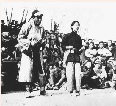
△演出街头剧《放下你的鞭子》