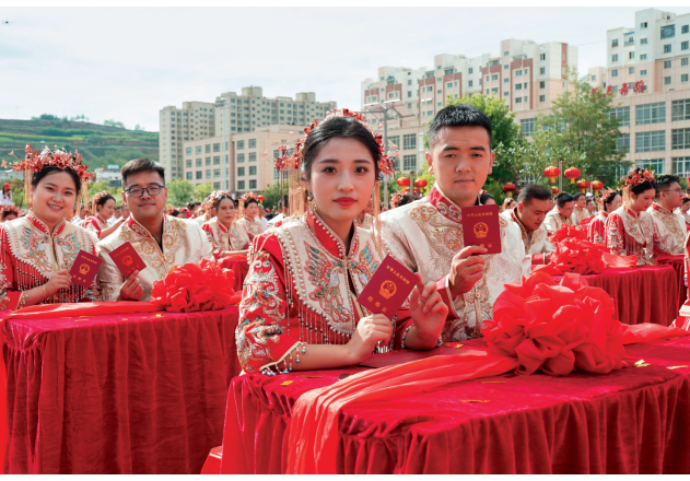
8月23日，第十三届陇南乞巧女儿节开幕活动中，百对新人身着融入乞巧文化元素的特色礼服，举行了一场别开生面的公益集体婚礼，以实际行动倡导移风易俗、喜事新办的社会风尚。

农历六月二十九日的黄昏，西和县姜席镇赵河村笼罩在一片喜庆的氛围中。晚霞将湖面染成金色，一群身着盛装的姑娘们手持香烛，在“巧头儿”柴琪的带领下，沿着乡间小路向晚霞湖畔走去。她们要去迎接一位特殊的“客人”——“巧娘娘”。 “七月初一天门开，我请巧娘娘下凡来……”悠扬的迎巧歌在暮色中回荡。姑娘们头戴红绳，手捧香烛，有的还小心翼翼地挑着“巧娘娘”的塑像。队伍最前方，几位年长女性神情肃穆，引领着这支特殊的迎亲队伍。 边走边唱，到达湖畔的“巧娘娘”塑像前，姑娘们虔诚地点燃香烛，轻声吟唱着古老的迎巧歌谣。她们相信，在这个特别的夜晚，“巧娘娘”会降临人间，赐予她们聪慧、灵巧和幸福美满的生活。 “每年就盼着这几天。”队伍中，一位十岁的小姑娘兴奋地说。虽然今年她们村没有设乞巧点，但在父母的支持下，她特意来到赵河村参加活动。小姑娘稚嫩的脸上写满期待，随着歌声轻轻摇摆身体。 当迎巧队伍返回坐巧人家的院子时，早已等候多时的村民们自动让出一条通道。上房内，主人恭敬地接过“巧娘娘”塑像，将其安放在正堂中央。供桌上，造型精美的面饽和新鲜水果已经摆放整齐。姑娘们开始载歌载舞，逐一祭拜这位“远道而来”的贵客。 据当地文化工作者介绍，迎巧是西和乞巧活动的第二个重要仪式，通常在农历六月最后一天的傍晚举行。这个传承千年的民俗活动，不仅寄托着人们对美好生活的向往，更是一代代西和女性智慧的结晶。 夜色渐深，迎巧仪式接近尾声，但属于乞巧节的狂欢才刚刚开始。在接下来的日子里，祭巧、娱巧、拜巧、卜巧和送巧等仪式将陆续上演，为这个陇南小城带来持续七天的文化盛宴。 迎巧仪式结束后，来自辖区内的各村民间乞巧队伍在悦湖广场、湖心岛等地，姑娘们身着盛装，载歌载舞，喜迎着节日的到来。 在这个夜里，古老的歌谣与现代的笑语交织在一起，传统民俗在年轻一代的参与中焕发新生。西和的乞巧文化，正以它独特的魅力，讲述着一个关于传承与创新的动人故事。