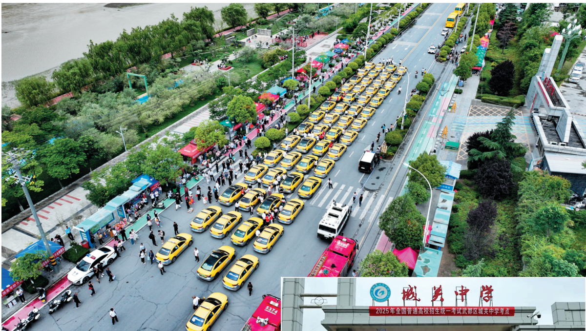
▲6月7日清晨，张贴“爱心送考车”标识的出租车整齐排列，为奔赴考场的学子们加油助威。 ▶考生走出城关中学考点。

据了解，为确保高考工作顺利进行，我市提早谋划、周密部署，加强组织领导，强化部门协作，在交通疏导、医疗保障、食品安全等方面提供精细化服务，把高考安全各项工作落细、落小、落实，确保高考安全平稳有序实施，实现“阳光高考、公平高考、平安高考”。