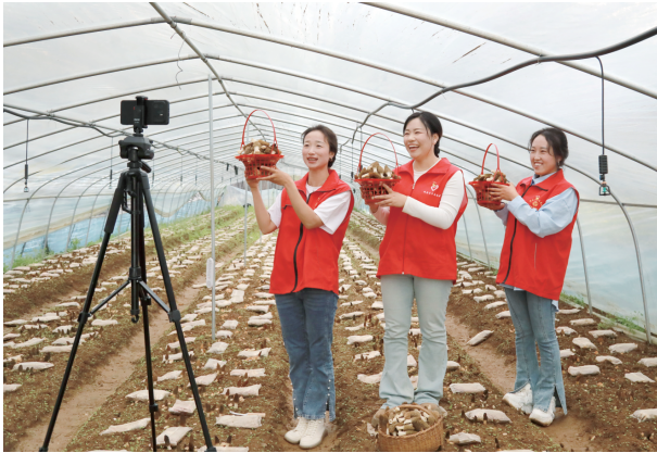
4月22日,徽县榆树乡火站村村干部在现场采摘和直播销售村集体经济合作社种植的羊肚菌。

近年来,榆树乡火站村因地制宜、利用当地优良的生态资源优势,以“党支部+合作社+农户”的模式,大力发展“一村一品”和家庭农场产业区,建成27座标准化羊肚菌大棚,通过农文旅融合,促进全村特色产业发展,壮大村集体经济,带动农户稳定增收。