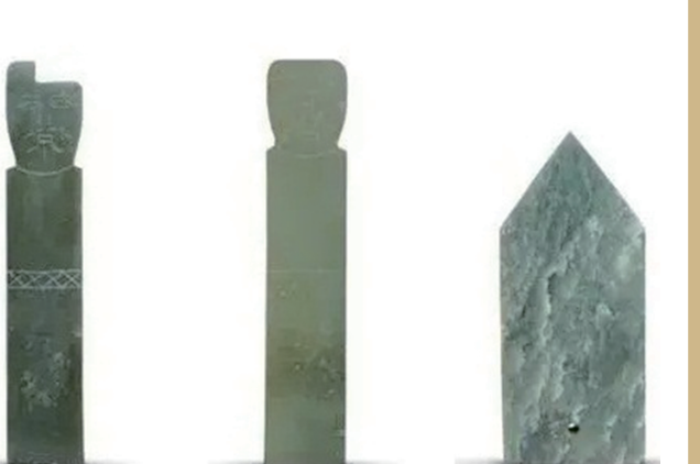
图4： 出土玉人（男） 出土玉人（女） 出土青玉圭

陇南玉文化史的研究，目前还是一个空白，无论是传世文献还是考古发现，都未见陇南史前时期有关玉文化的记载。从考古发现看，最早的陇南玉器实物出土，应该是2005年在礼县西山遗址M2003早秦墓葬出土的玉璧、圭、璋、戈、玦、管等十余件，已经成为系列（如图3），时间断限在西周中晚期（距今2800年左右）。