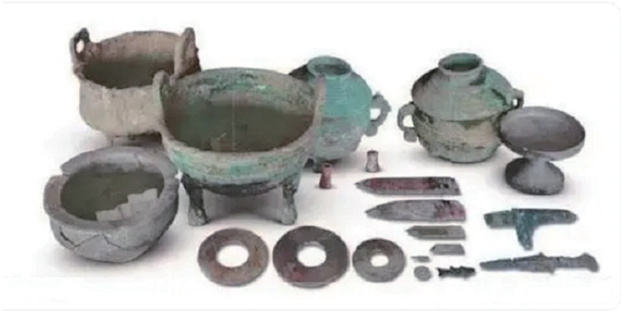
▲图3 礼县西山遗址出土的玉器系列

因为对西山遗址的考古发掘报告一直没有发表，而见诸于报刊、书籍的研究成果，重点在葬俗、城址，对陪葬品的研究主要在陶器、青铜器方面，对玉器的产地、质地、磨制技术与工艺、器形特征等系列研究基本没有展开，偶有提及也语焉不详。从图片资料看，这些玉器制作欠精致，均为片状佩饰，未见多种佩件组合的串饰，部分器物有简单纹饰，玉圭数量较多。可以看出受周文化中玉礼器文化影响较大，玉圭地位显高，居其他诸玉器之首。近见陇南市博物馆收藏一些征集玉器，部分出土于白龙江流域，其中角弓镇商周时期玉琮1件、玉璜3件，两水镇战国时期玉璧1件，丰富了陇南先秦玉文化史，进一步研究的价值很大。