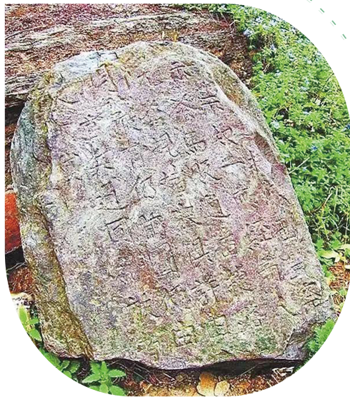
康县望关镇《察院明文》残碑,见证茶马古道流金岁月。 资料图