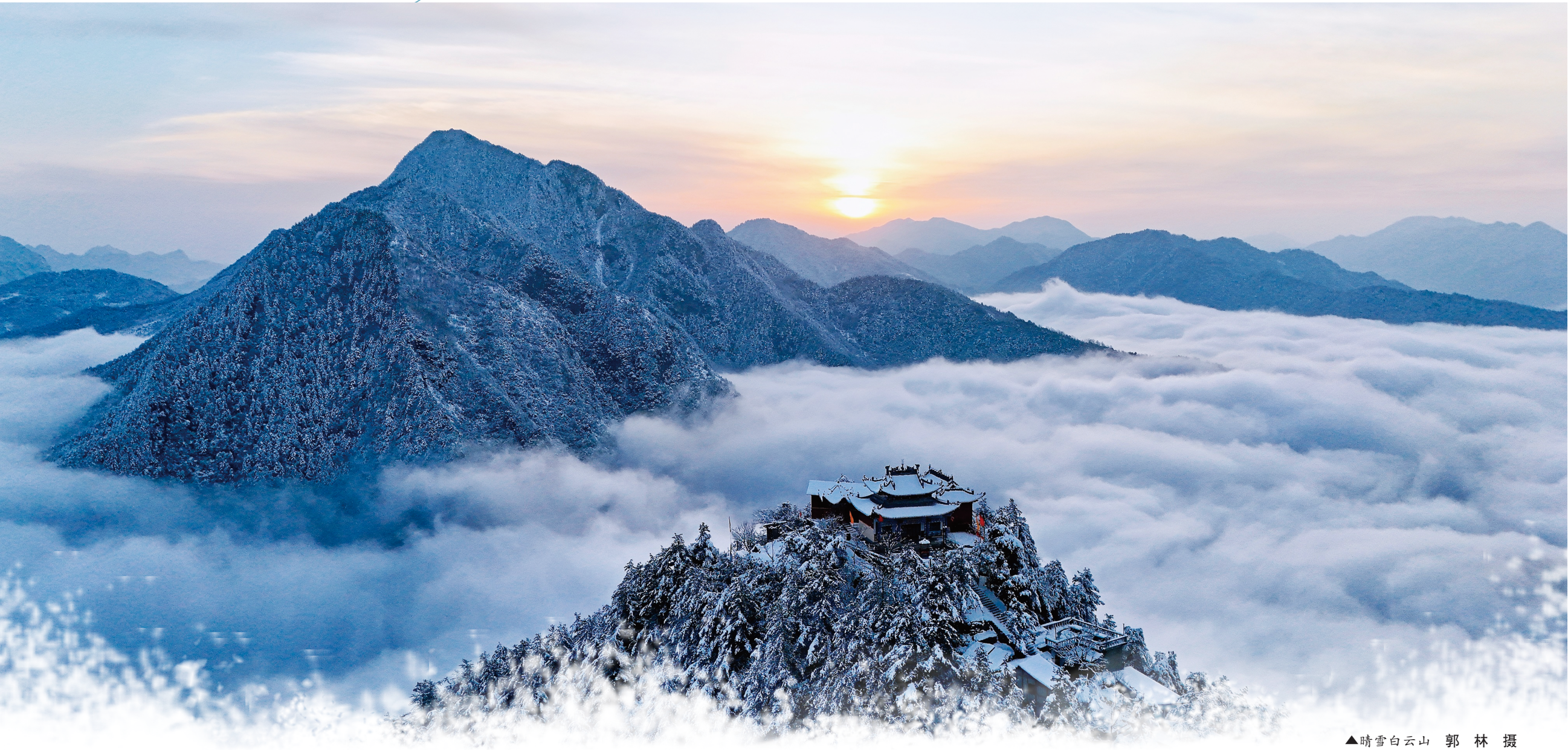
▲晴雪白云山