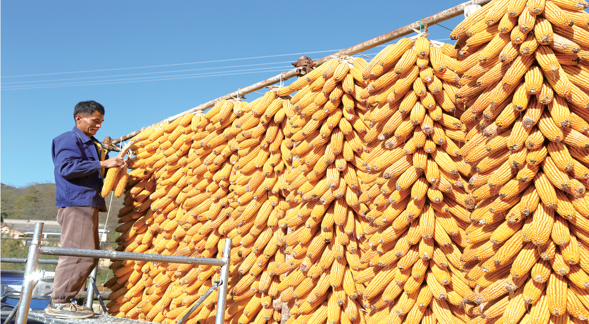
连日来，西和县苏合镇丁河村村民抢抓晴好天气晾晒玉米。近年来，西和县围绕“粮食增产、农民增收”的目标，因地制宜调整种植结构，玉米种植面积达8.7万余亩，为粮食增产增收奠定了基础。

玉米作为优质的青贮原料，其生产周期短、种植密度大、产量高，茎、叶、果实经粉碎加工和发酵，就可制作为青贮饲料。据了解，兴隆镇种植玉米280亩，一亩可转化饲料3吨左右，每吨产值500-600元，实现了农牧业互补互促，农业效益得到稳步提升，农民收入实现了稳步增长。