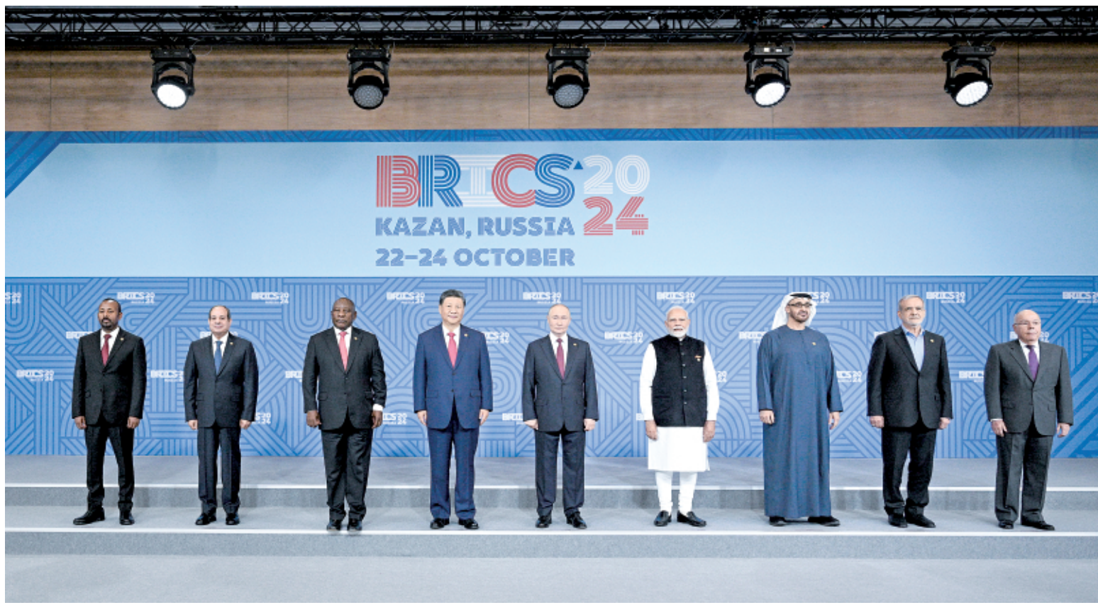
当地时间10月23日上午,金砖国家领导人第十六次会晤在喀山会展中心举行。俄罗斯总统普京主持会晤。中国国家主席习近平、巴西总统卢拉(线上)、埃及总统塞西、埃塞俄比亚总理阿比、印度总理莫迪、伊朗总统佩泽希齐扬、南非总统拉马福萨、阿联酋总统穆罕默德等出席。这是会晤期间,金砖国家领导人集体合影。