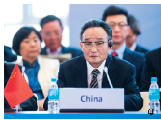
图⑪：2013年1月28日，吴邦国同志在俄罗斯符拉迪沃斯托克出席亚太会议论坛第21届年会，并作题为《坚持和平发展促进合作共赢》的主旨发言。