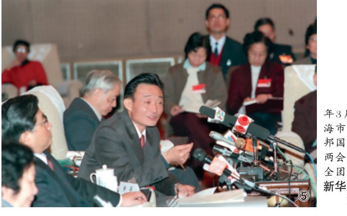
图⑤：1994年3月，时任上海市委书记的吴邦国同志在全国两会上海代表团全团会议上。

企业优胜劣汰机制，坚持从战略上调整国有经济布局 and 改组国有企业，支持具有优势的大公司大企业集团进一步做强做大，使其成为国民经济重要支柱和参与国际竞争主要力量。他十分重视企业管理创新，大力推进企业信息化建设，推动加强成本管理、资金管理和质量管理，不断提高企业现代化管理水平。他始终把就业摆在突出位置，坚持实行鼓励兼并、规范破产、下岗分流、减员增效和实施再就业工程的方针，推动制定出台一整套符合基本国情、顺应时代发展要求的促进就业再就业政策，加强社会保障体系建设，为社会大局稳定、国民经济健康发展创造良好条件。