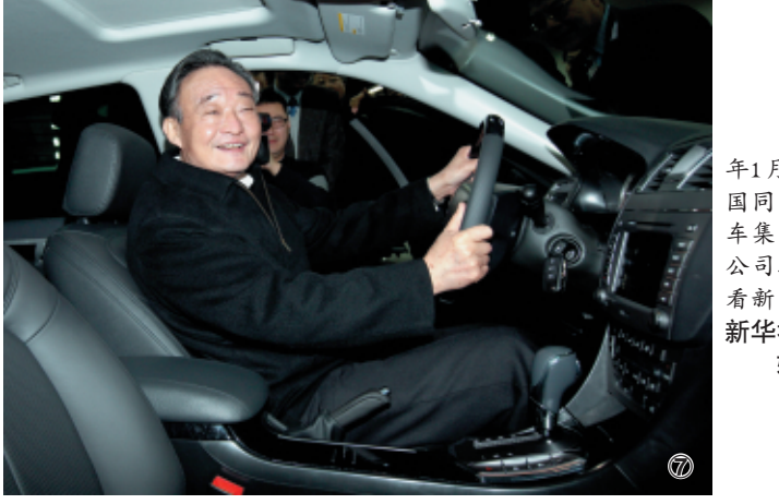
图⑦：2010年1月30日，吴邦国同志在上海汽车集团股份有限公司技术中心察看新能源样车。

2002年11月，吴邦国同志在中共十六届一中全会上当选为中央政治局委员、常委。2003年3月，在十届全国人大一次会议上，他当选为全国人民代表大会常务委员会委员长，同月任全国人大常委会党组书记。2007年10月，他在中共十七届一中全会上再次当选为中央政治局委员、常委。2008年3月，在十一届全国人大一次会议上，他再次当选为全国人民代表大会常务委员会委员长，同月任全国人大常委会党组书记。他认真贯彻落实党中央决策部署，坚持正确政治方向，依法履行职责，不断增强工作实效，进一步丰富和发展人民代表大会制度的理论和实践，为发展社会主义民主、健全社会主义法制作出重要贡献。他强调，发展社会主义民主政治，必须坚持党的领导、人民当家作主和依法治国有机统一起来，坚持和完善人民代表大会制度这一根本政治制度，必须坚持党的领导，决不能削弱党的领导、脱离党的领导、放弃党的领导，决不能搞西方那种多党制、议会制，中国对自己选择的政治发展道路要理直气壮地宣传，坚决抵制各种错误思潮影响。