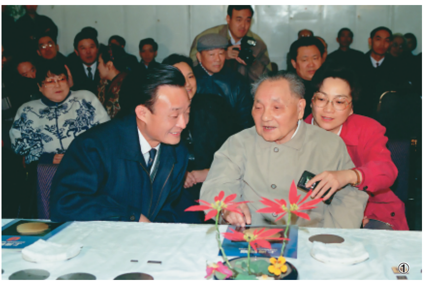
图①：1992年2月10日，邓小平同志在上海贝岭微电子制造有限公司参观时与吴邦国同志交谈。新华社记者 柳中央 摄