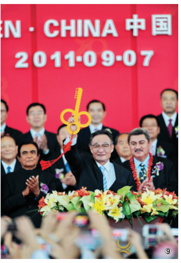
图⑨：二〇一一年九月七日，吴邦国同志在福建厦门出席第十五届中国国际投资贸易洽谈会开幕式。