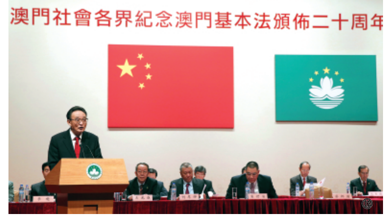
图⑫：2013年2月21日，吴邦国同志在澳门文化中心出席澳门社会各界纪念澳门基本法颁布20周年启动大会并发表讲话。新华社记者 鞠鹏 摄