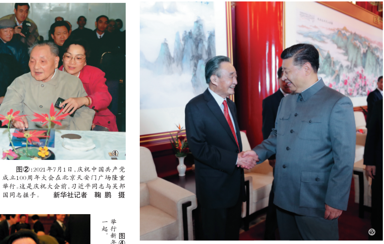
图②：2021年7月1日，庆祝中国共产党成立100周年大会在北京天安门广场隆重举行。这是庆祝大会前，习近平同志与吴邦国同志握手。