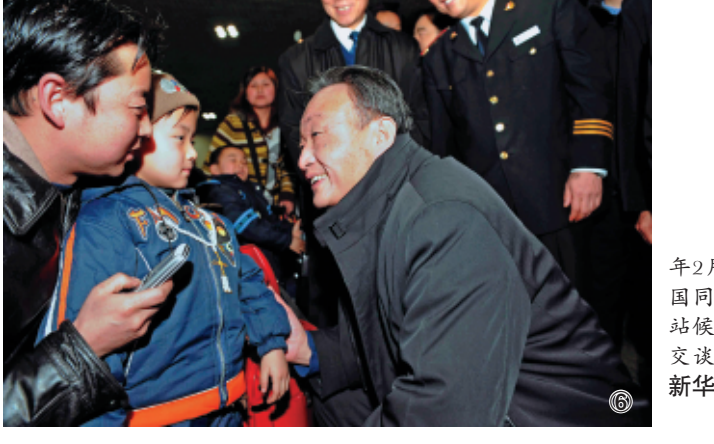
图⑥：2008年2月3日，吴邦国同志在北京西站候车室与旅客交谈。

在分管基础设施建设工作中，吴邦国同志坚持统筹规划、突出重点、合理布局、质量第一，集中力量建成一批关系全局的重大基础设施，切实增强我国经济发展后劲。他始终情系三峡、关心三峡，对三峡工程质量保障、重大装备国产化、三峡总公司转型发展等进行具体指导，扎实做好移民安置工作，为优质高效建设三峡工程作出突出贡献。他坚持把公路建设放在党和国家事业发展的全局来谋划和推进，明确我国公路发展战略、规划、技术标准和管理体系等重大问题，推动公路建设驶入快速发展轨道。他着力推进铁路建设和发展，坚定支持铁路大提速，推动京九、南昆等铁路全线投入运营，青藏铁路开工建设，开创铁路工作新局面。他大力支持上海洋山深水港立项建设，为打造上海国际航运中心发挥重要作用。他高度重视邮电通信建设，有力推进移动通信跨越式发展，推动长途光缆线路建设空前快速发展。