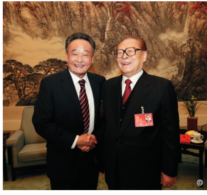
图③：2012年11月14日，中国共产党第十八次全国代表大会在北京闭幕。这是闭幕会前，江泽民同志与吴邦国同志在一起。