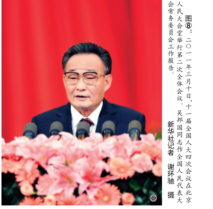
图⑧：二〇一一年三月十日，十一届全国人大四次会议在北京人民大会堂举行第二次全体会议。吴邦国同志作全国人民代表大会常务委员工作报告。

吴邦国同志是中国特色社会主义民主法治建设的重要领导者。他强调，如果没有比较完备的、高质量的法律法规，就谈不上实现社会主义民主政治的制度化、规范化和程序化，就谈不上依法治国、建设社会主义法治国家。在党中央领导下，他将立法工作作为全国人大及其常委会的首要任务，紧紧围绕党中央确定的立法工作目标，坚持科学立法、民主立法，适应社会主义市场经济发展、社会全面进步和加入世贸组织的新形势，把中国特色社会主义法律体系中基本的、急需的、条件成熟的法律作为立法重点，抓紧制定修改相关法律，集中开展法律清理工作。2003年3月，他担任中央宪法修改小组组长，在中央政治局常委会领导下主持宪法修改工作。由十届全国人大二次会议通过的宪法修正案，确立了“三个代表”重要思想在国家政治和社会生活中的指导地位，明确国家尊重和保障人权、依法保护公民的私有财产权和继承权等内容，对促进我国经济社会发展、推进中国特色社会主义民主法治建设具有重要意义。在他的主持下，第十届、十一届全国人大及其常委会共审议通过宪法修正案草案、法律草案、法律解释草案和有关法律问题的决定草案186件，包括物权法、企业破产法、企业所得税法、公务员法、行政许可法、治安管理处罚法、劳动合同法、未成年人保护法、妇女权益保障法、关于加强网络信息保护的決定等。在党中央领导下，他主持制定反分裂国家法，把党和国家对台工作的大政方针和政策措施以法律形式固定下来，为反对和遏制“台独”分裂活动、促进祖国和平统一提供有力法律保障。（下转第三版）