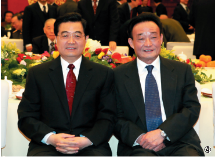
图④：二〇〇五年一月一日，全国政协在北京举行新年茶话会。这是胡锦涛同志与吴邦国同志在一起。