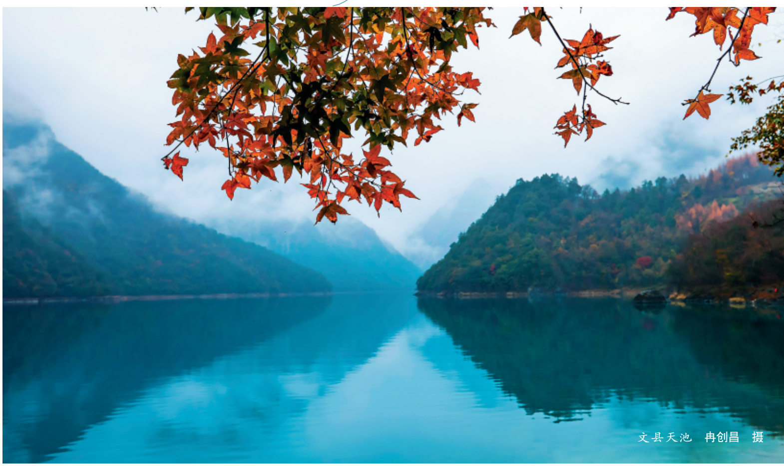
文县天池