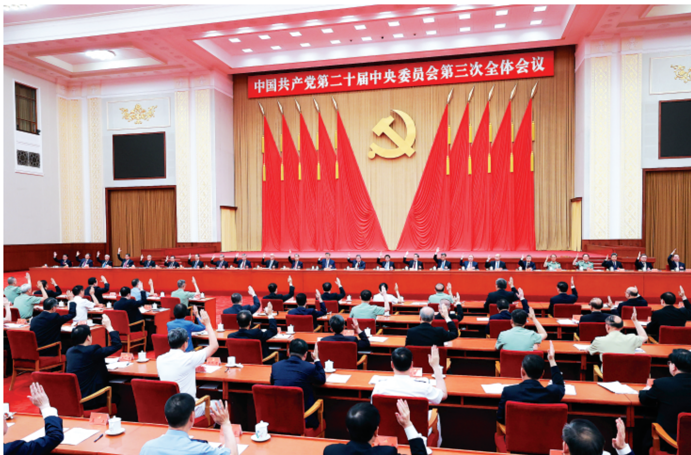
中国共产党第二十届中央委员会第三次全体会议,于2024年7月15日至18日在北京举行。中央委员会总书记习近平作重要讲话。