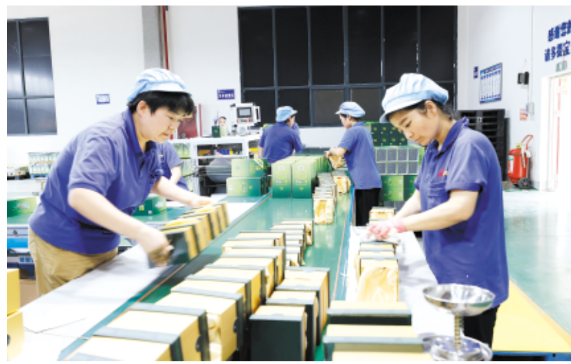
陇南经济开发区厂区内工人正在加工产品。

建泉州招商引资的‘桥头堡’,知责于心、担责于身、履责于行,一如既往地两地企业交流合作牵线搭桥。”福建四方开源实业有限公司董事长、甘肃青芒果服饰有限公司投资人田旭说道。