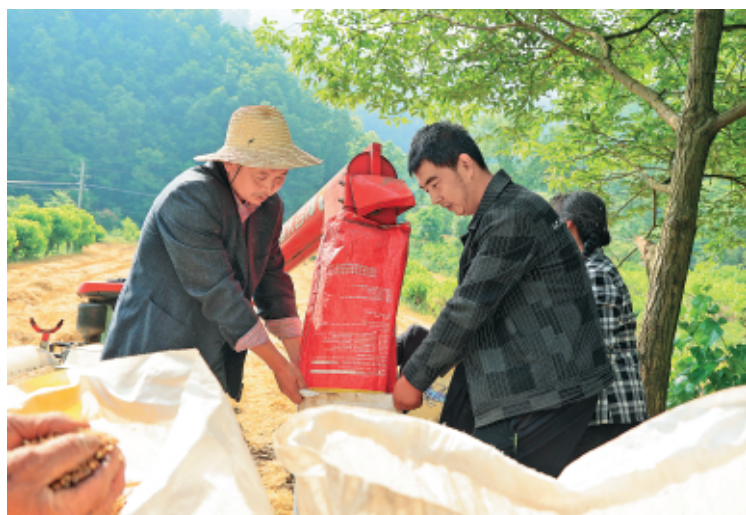
全市122.29万亩冬小麦由南向北陆续开镰,田里麦浪滚滚,一片金黄,联合收割机穿梭往返,机声隆隆,一派丰收的景象。