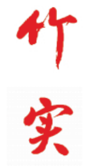
第1982期 书法作品 【作者】 金全