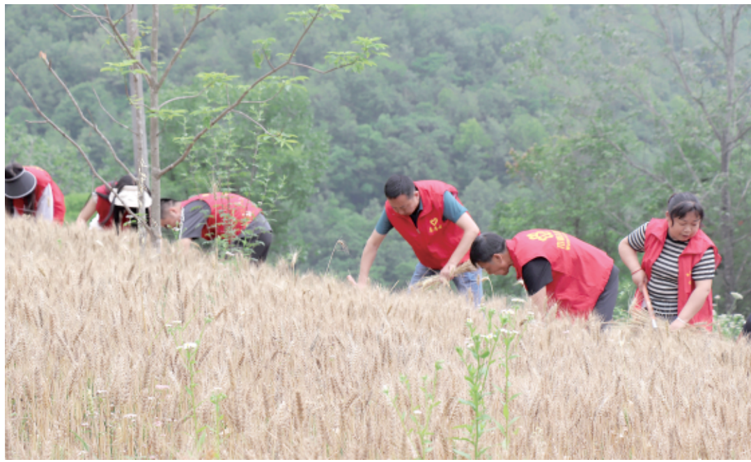
6月3日,康县白杨镇“三夏”党员干部志愿服务队在帮助农户收割小麦。“三夏”农忙时节,白杨镇党员干部急群众所急,针对高山区小麦机械抢收难和农户缺少劳动力的实际,及时组建党员干部“三夏”志愿服务队,深入田间地头开展抢收、抢晒小麦等志愿服务,充分发挥党建引领和党员先锋模范作用,确保群众夏粮颗粒归仓。

“三夏”生产工作开展以来,我市农机部门立足“早”字,着眼“抢”字,夯实农机力量、技术力量等要素向“三夏”集中。截至目前,全市122.29万亩冬小麦已完成小麦机收面积3.51万亩,小麦机收损失率控制在1%以下。夏收期间,全市预计投入联合收割机3200台,“三夏”生产投入各类农机具30000台。