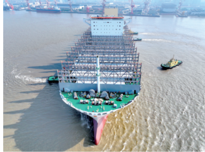
5月7日，“中远川崎397”集装箱船出海试航（无人机照片）。当日，由江苏南通中远海运川崎船舶工程有限公司自主设计、研发制造的“中远川崎397”集装箱船出海试航。该船长399.99米，型宽61.3米，型深33.2米，可装载24188个国际标准集装箱。

大以来政法领域中管干部被查处情况，编写学习资料，以身边案例和《条例》条款相结合，强化以案说纪、以案说责，完善队伍教育管理、预警预防、监督惩处等制度措施，推动党员干部强化纪律观念、加强自我约束、提高免疫力。