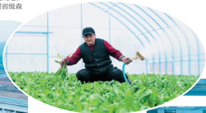
上图：成县店村镇菜农正在蔬菜大棚里管护时令蔬菜。 左图：航拍甘肃红川酒业有限责任公司年产1.2万吨纯粮原浆白酒建设项目。 右图：成县小川镇华龙恒业有限责任公司员工正在挑选核桃仁。