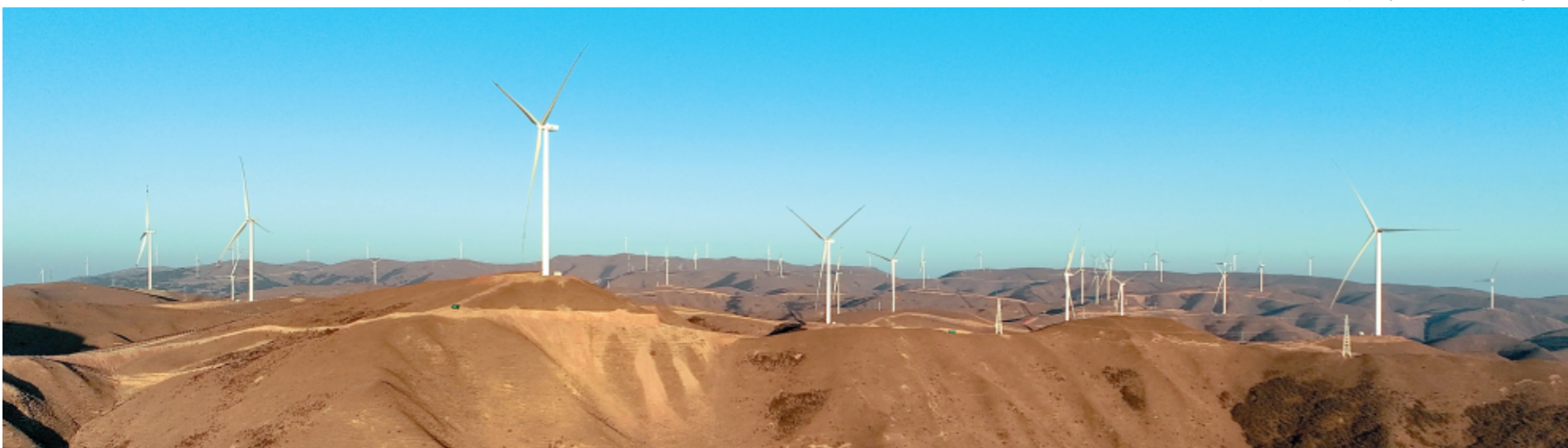
礼县固城200兆瓦风力发电场。