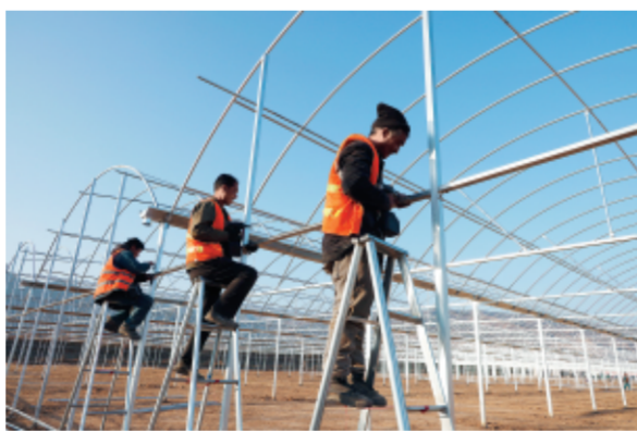
礼县石桥现代设施农业产业园里工人在搭建连栋大棚。