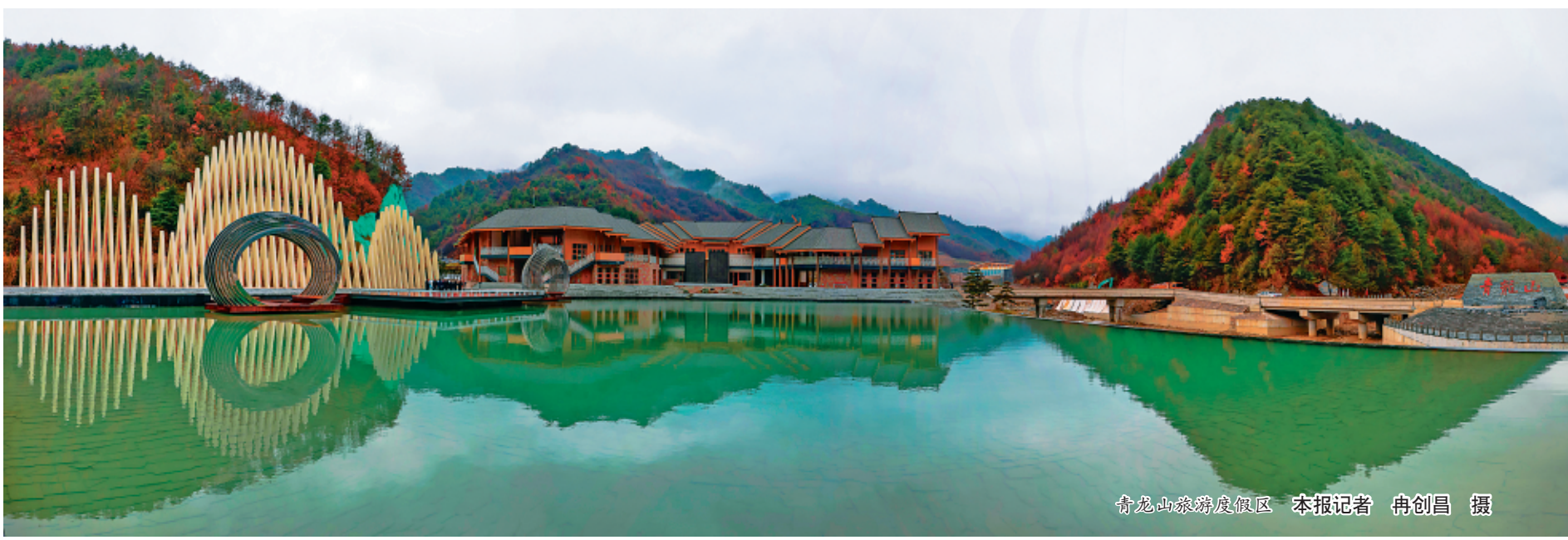
青龙山旅游度假区

截至2023年11月，当年村均集体经济收入达到16.45万元，经营性收入村均达到12.61万元，全县当年村级集体经济累计收入达到5758.72万元，其中10万元以上的村数占比达到89.7%。（陇南市融媒体中心采访组）