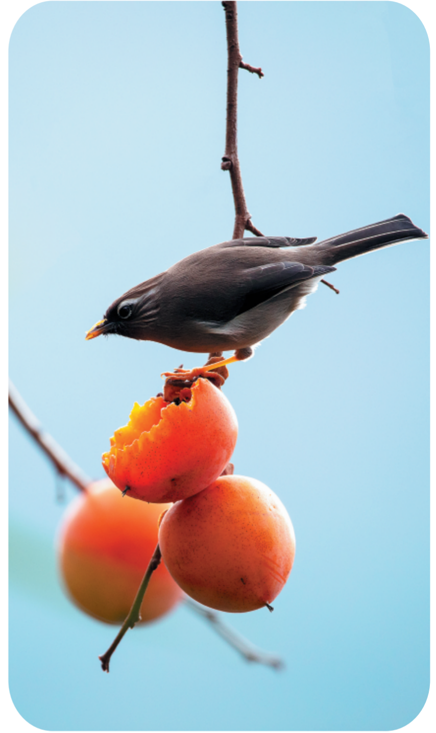
▲本报通讯员郭林拍摄于康县白云山森林公园