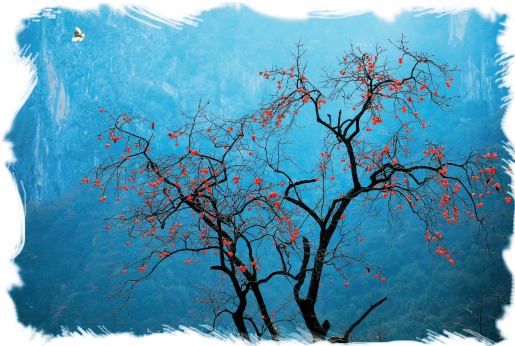
▲本报记者李旭春拍摄于徽县嘉陵镇严坪村

一颗颗熟透的柿子，从枝头摘下，散发出诱人的甜香，咬一口，感受初冬的宁静与美好，感恩大自然的无私馈赠。“色胜金衣美，甘逾玉液清。”品尝柿子的甜蜜，是这个季节喜悦的事情之一。火红的柿子，增添了暖意，装点着初冬的风景，更映红了农户的生活。