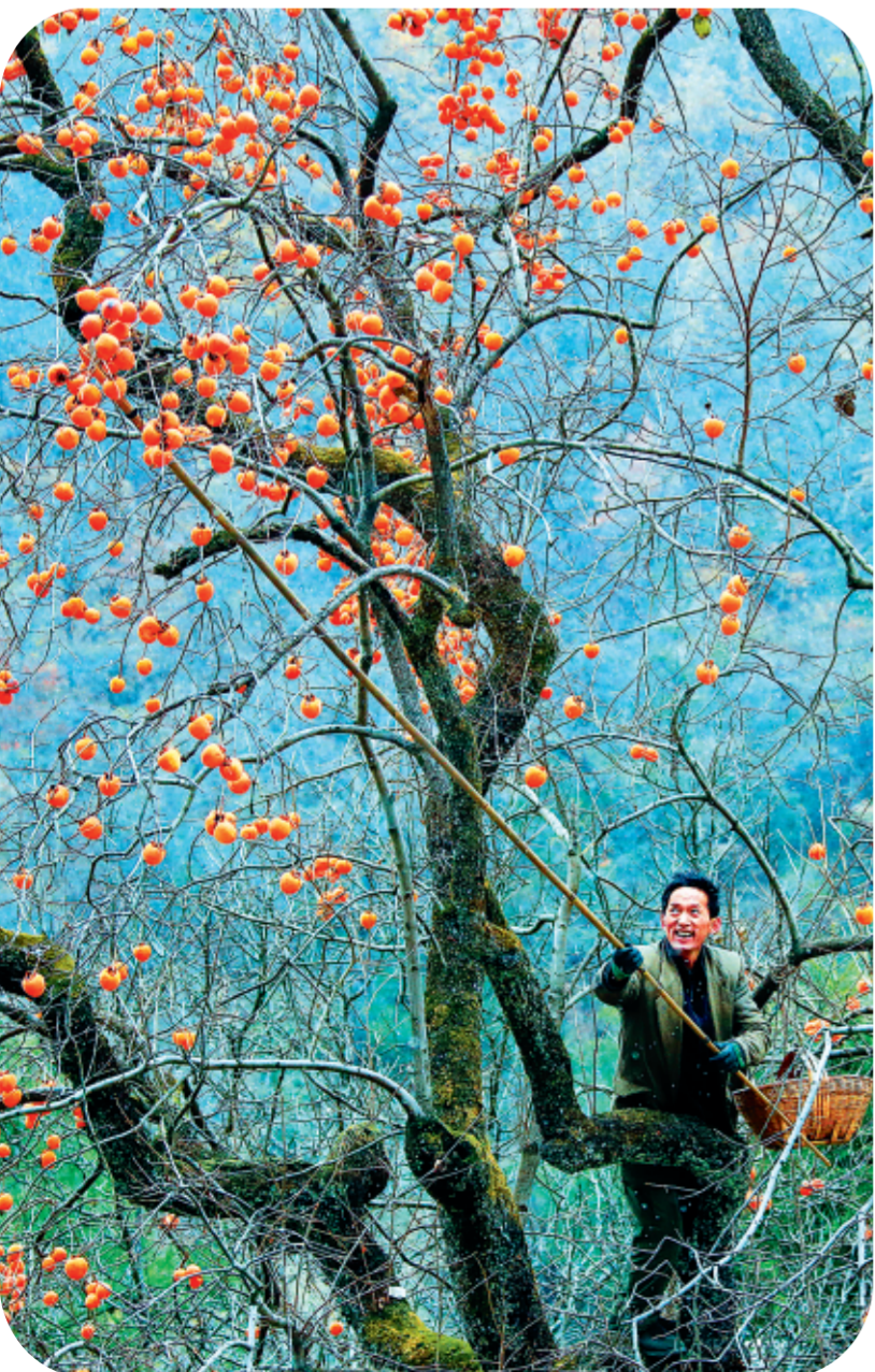
▲本报记者冉创昌拍摄于两当县显龙镇