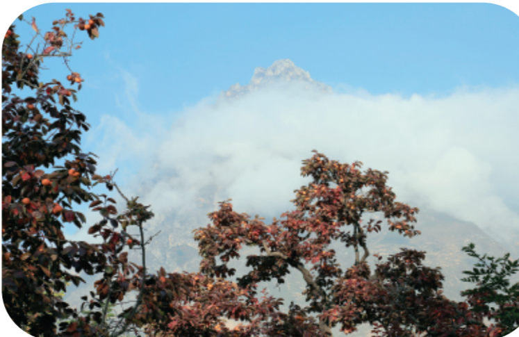
▲本报记者李旭春拍摄于宕昌县两河镇化马村