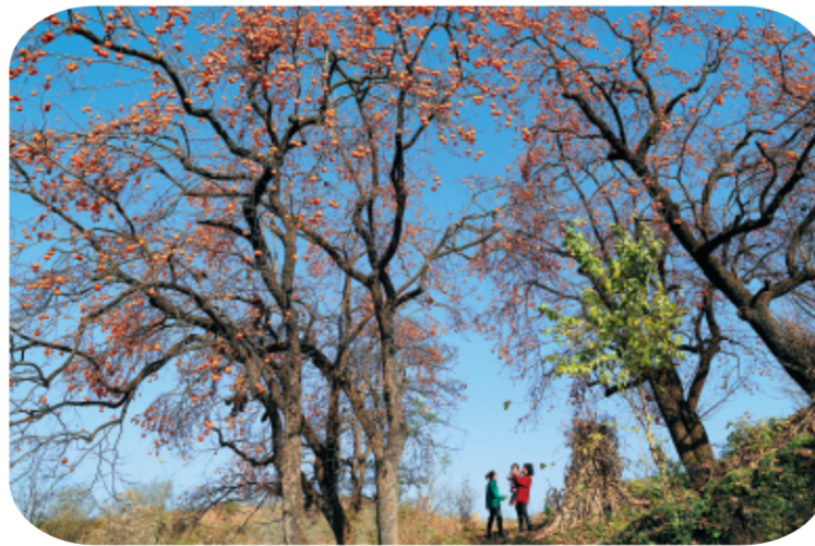
▲本报记者李旭春拍摄于徽县水阳镇