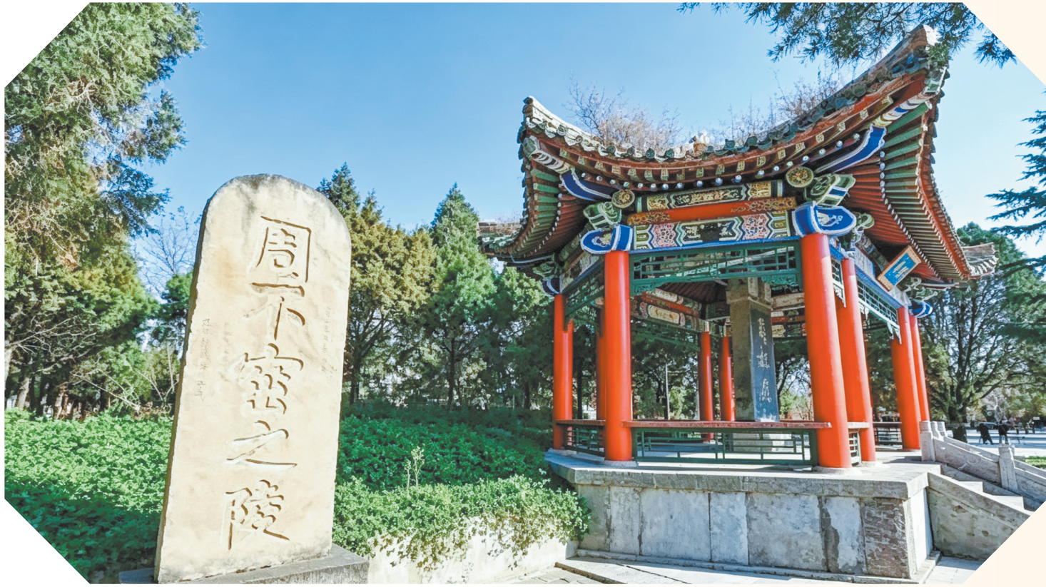
庆阳周祖陵景区的周不窋之陵

陇东先周农耕技术已颇有系统性,体现在生产工具的使用、灌溉施肥、作物选育等方面。工具方面,《七月》载:“取彼斧斨,以伐远扬”“三之日于耜,四之日举趾”,其中“斨斨”用于修剪桑枝,“耜”为曲柄起土农具,即耒耨。同时,应当还发展了“牛耕”的新型技术。《周礼·考工记》贾公彦疏云:“用牛耕故有两脚耜”,“两脚耜”应是牛而设。考古发现,在甘