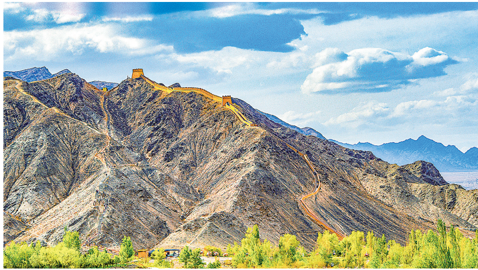
悬壁长城壮美如画。李巍

“嘉峪关不仅有雄伟的长城,更有深厚的文化、热情的人民,值得全世界来看。”文旅宣传推介官的话语,道出了这座城市的自信与魅力。