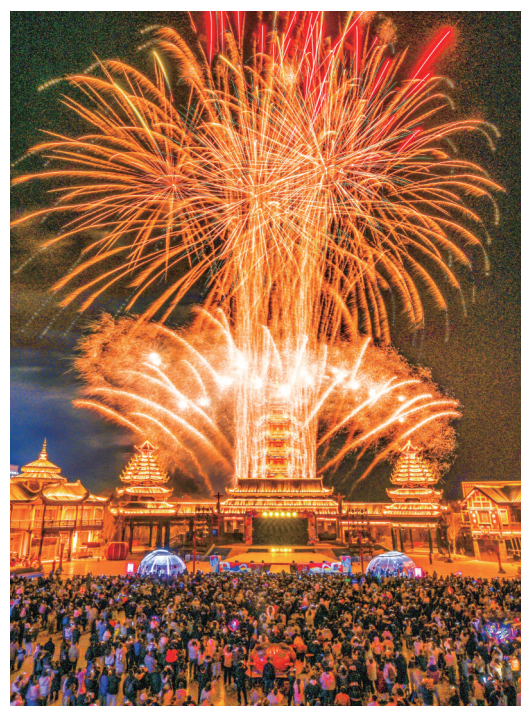
嘉峪关方特烟火表演。

万里长城起雄关,文旅融合开新篇。嘉峪关,这座承载千年戍边记忆的丝路咽喉,正以文旅融合的澎湃活力焕发时代新颜。世界文化遗产的厚重底色上,夜游光影绘就了长城史诗,研学足迹丈量了古今变迁,文创巧思点亮了戈壁流年。这里不仅有“天下第一雄关”的壮怀激烈,更有“四季皆景、全时可游”的时尚脉动。当历史与现代交相辉映,当保护与发展同频共振,嘉峪关正自信地向世界发出邀请:读懂长城,从嘉峪关开始;奔赴热爱,在雄关相遇。