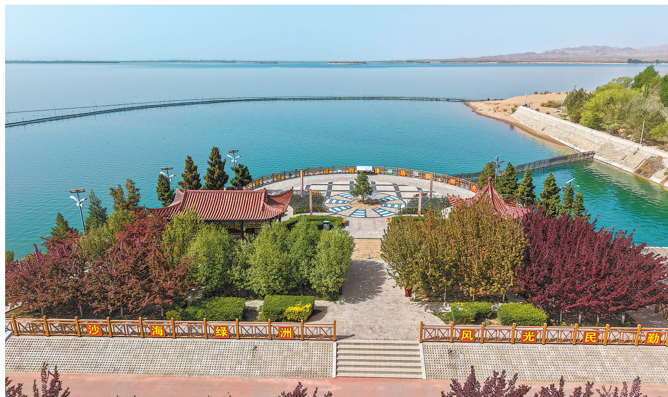
暮春时节,武威市民勤县红崖山水库碧波荡漾,风光旖旎,宛若一颗璀璨明珠镶嵌在苍茫大漠之中。

项目首创“智能巡航+智能控制+智能盘查”三位一体智慧运行、多参数异步协同高效控制、轻量化边缘云与异构云边协同等技术,构建起行业领先的燃煤机组智慧运行体系,为我国新型电力系统建设提供了新的智能化方案。