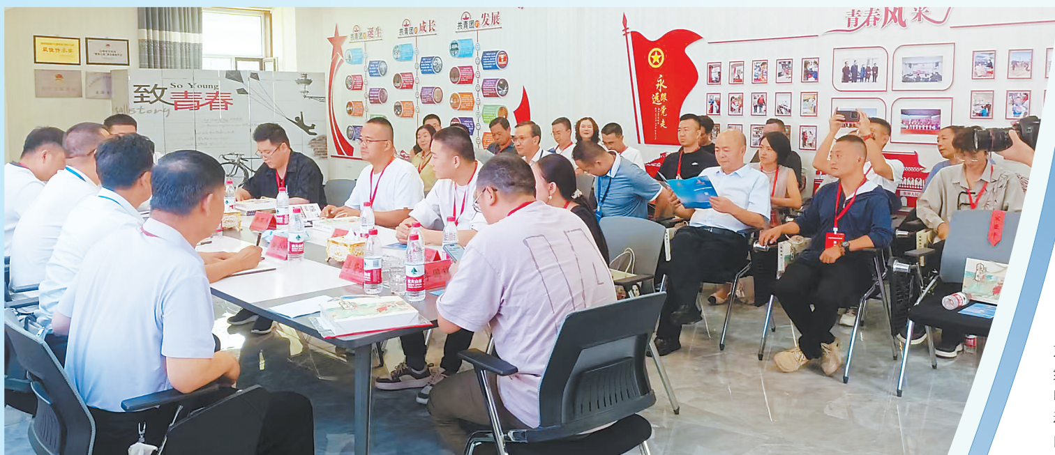
2025年8月,全省优秀网络作家代表交流研讨。(资料图)