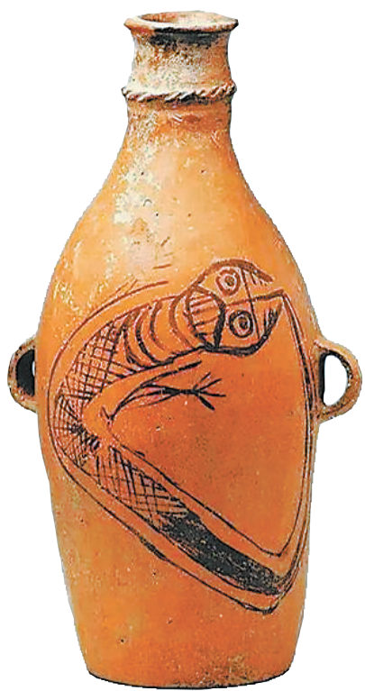
甘谷县出土的鲋鱼纹彩陶瓶

这片被冠以“初县之”名号的冀戎故地,便是古之冀县,今之甘谷——中国县制肇始之地。