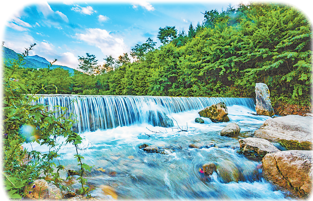
宕昌县官鹅沟国家森林公园 本版图片均为资料图

东汉时,人们在广泛沿用“陇西”一名的同时,学界就已经开始形成“陇”之南的概念。郦道元《水经注》引郑玄注《尚书》云:“西倾,雍州之山也,雍、戎二野之间,人有所于京师者,道当由此州而来。桓是陇坂名,