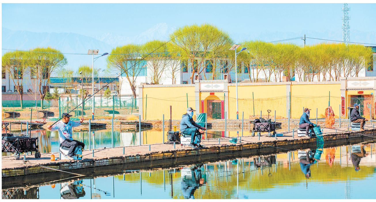
4月5日,在张掖市甘州区党寨镇马站村鱼塘,众多钓鱼爱好者正在垂钓,乐享春日时光。

春风送暖,消费升温。假日期间,兰州景区和商场着力营造个性化、沉浸式、互动式的消费体验,打造新场景,丰富新业态,连接起“吃、住、行、游、购、娱”全产业链的复合型经济形态,以高质量供给、人性化服务,激发消费潜力,呈现出热气腾腾、蒸蒸日上的消费景象。