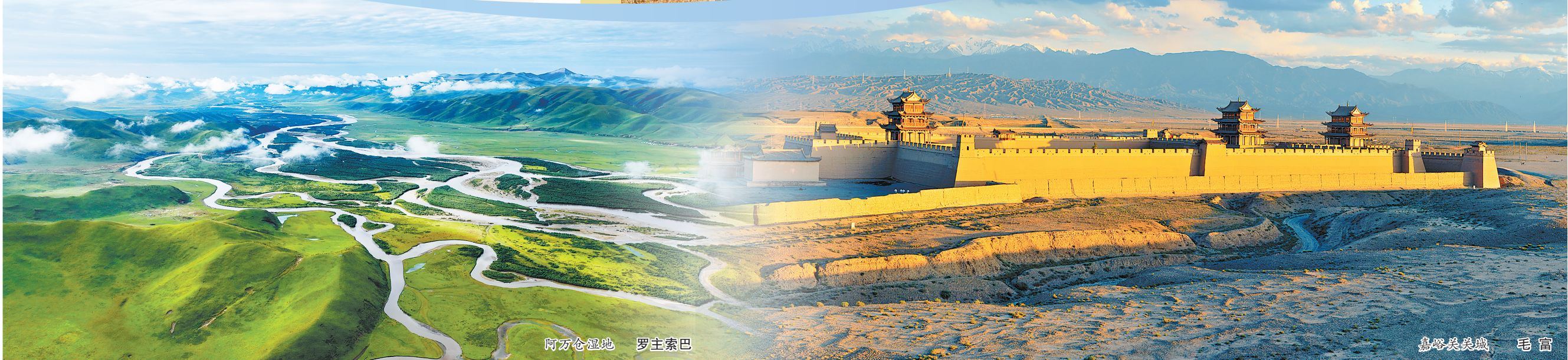
阿万仓湿地 罗主索巴

能承载情感的重量,陇原大地正以其独特的魅力,吸引着更多创作者前来书写影像传奇。 (作者系甘肃省电影家协会常务副主席)