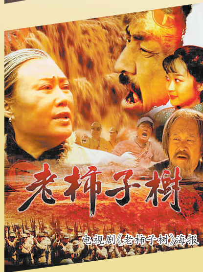
电视剧《老柿子树》海报