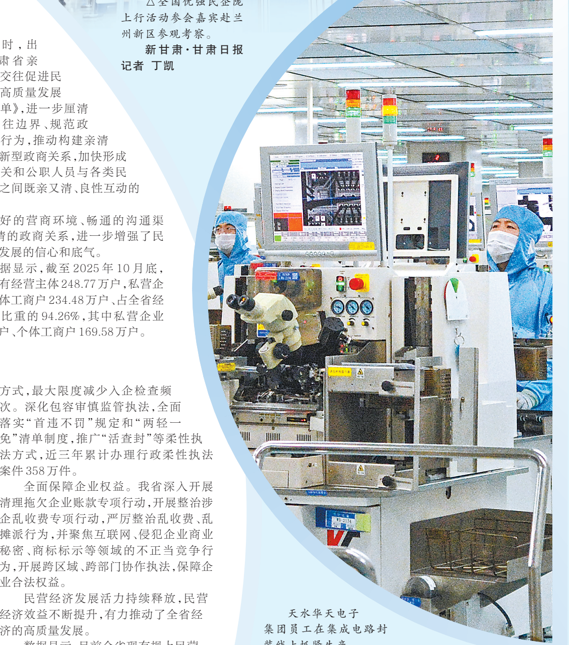
天水华天电子集团员工在集成电路封装线上抓紧生产。