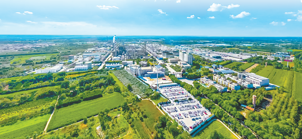
庆阳石化公司全貌。