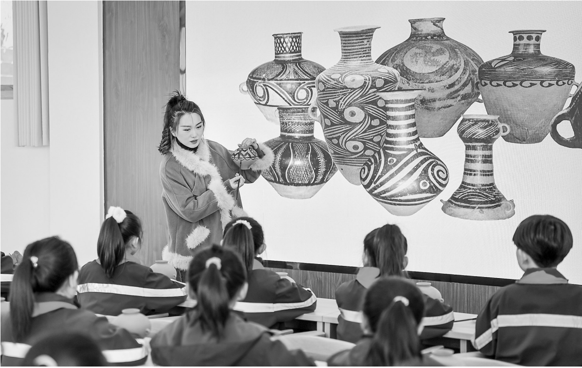
研学马家窑文化 田 璞

“密码”部分从制陶说起。如何制作精美的彩陶,哪里取土?怎么画彩?这是重头戏。马家窑文化的彩陶实在太精美了,即便陇东的南佐都邑,仅就彩陶技术而论,也无法与其相比。尖底瓶当然是酒器,用于祀天祭祖,祭祀时少不了鼓乐。我们可以想象一下五千年前马家窑先民击鼓吹埙,载歌载舞,以酒祭奠生动而又神圣的场景。那些繁复多样的彩陶图案和符号,现在已很难确知其意,但马家窑先民想必是熟知的。或许在他们心中,蛙纹真的就和女媧、和“造人”有关呢。而艺术源于生活这句话,在马家窑文化彩陶上则得到了最好的诠释。