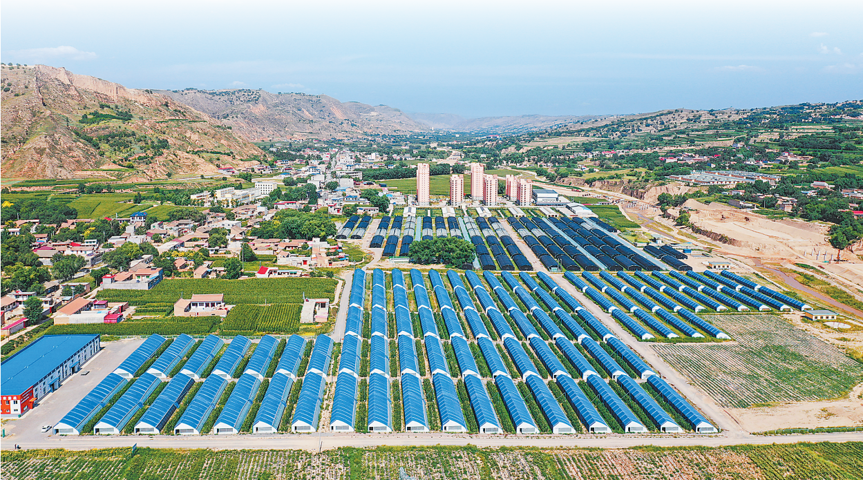
东乡县沿川经济带设施农业。

东乡,将贫困的帽子甩到了身后!这片曾经荒芜贫瘠的土地,日益焕发出新的生机。今年前三季度,东乡10项主要经济指标增速高于临夏州平均水平,其中,3项指标增速居临夏州第一。