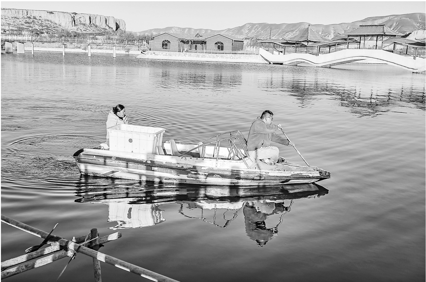
11月25日,在定西市安定区鲁家沟镇凤城湖养殖基地,蟹农正在捕捞中华绒螯蟹。安定区鲁家沟镇依托“引洮工程”和清凉气候条件,发展大闸蟹特色养殖。

从机构整合的物理重组到职能优化的化学反应,从机制创新的破局之举到效能提升的蝶变之效,兰州新区以机构改革为突破口,走出了一条独具国家级新区特色的改革发展之路。站在新的起点上,兰州新区正持续深化改革、扩大开放,让体制机制优势不断转化为高质量发展胜势,在谱写中国式现代化甘肃篇章的征程中书写更多精彩答卷。