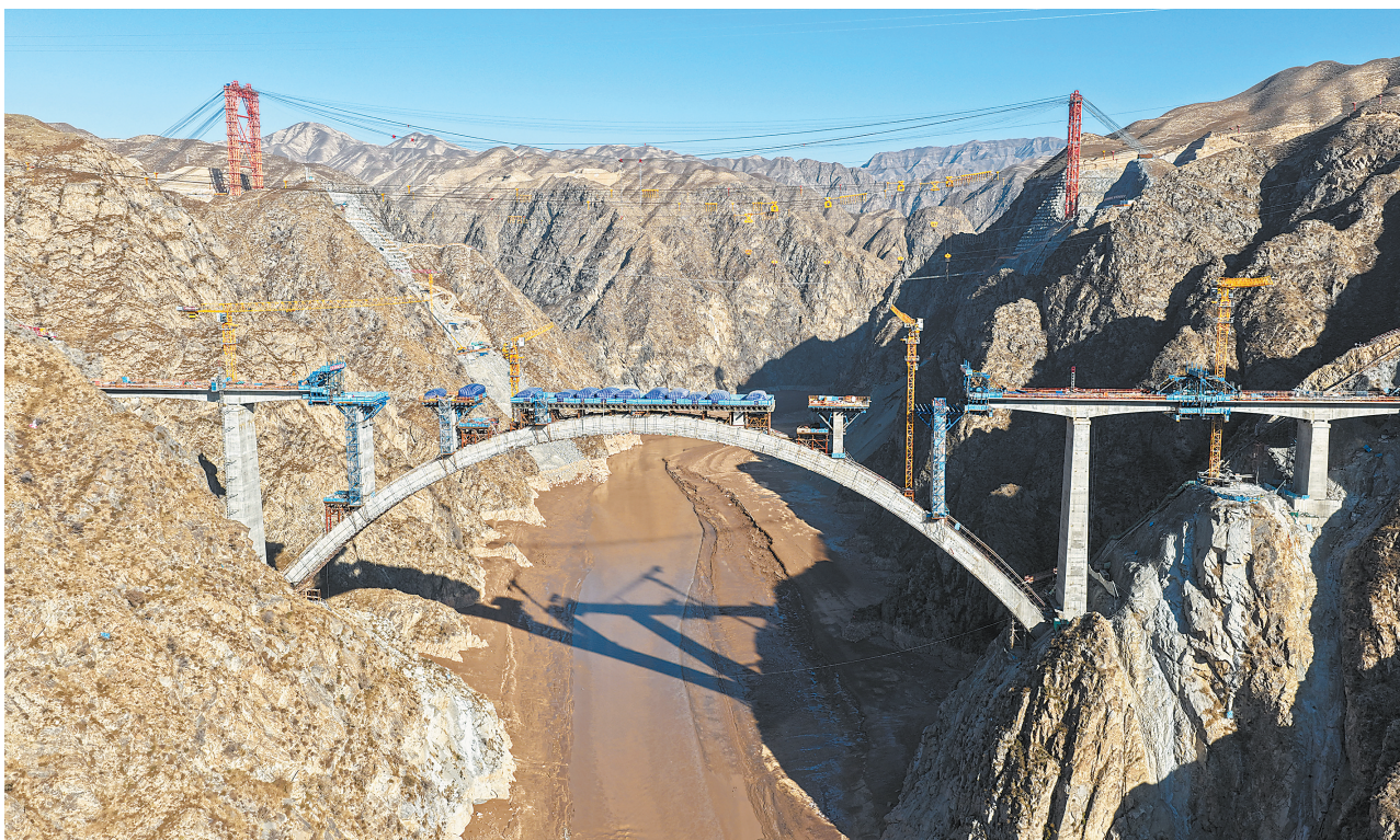
初冬,中国铁建大桥局工人在兰合铁路洮河大桥上加紧施工。目前,洮河大桥拱上立柱工程全部完成,为兰合铁路按时通车奠定了坚实基础。

据统计,“十四五”时期,临夏州抓项目育产业、抓招商引强企、抓改革促开放,地区生产总值从2020年的352.7亿元增长至2024年的506亿元、年均增长7%。争取实施亿元以上重大项目517个,固定资产投资年均增长23.5%,