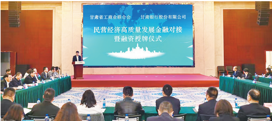
甘肃银行助力民营经济高质量发展金融对接暨融资授牌仪式。

服务实体经济是金融的立业之本,也是甘肃银行十四年来始终坚守的初心使命。作为甘肃本土金融机构,甘肃银行将自身发展融入区域经济发展大局,通过精准施策、优化服务,为地方经济发展提供坚实金融支撑,成为推动甘肃实体经济高质量发展的重要力量。