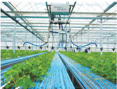
甘肃银行信贷支持的果蔬企业现代化农业生产基地。