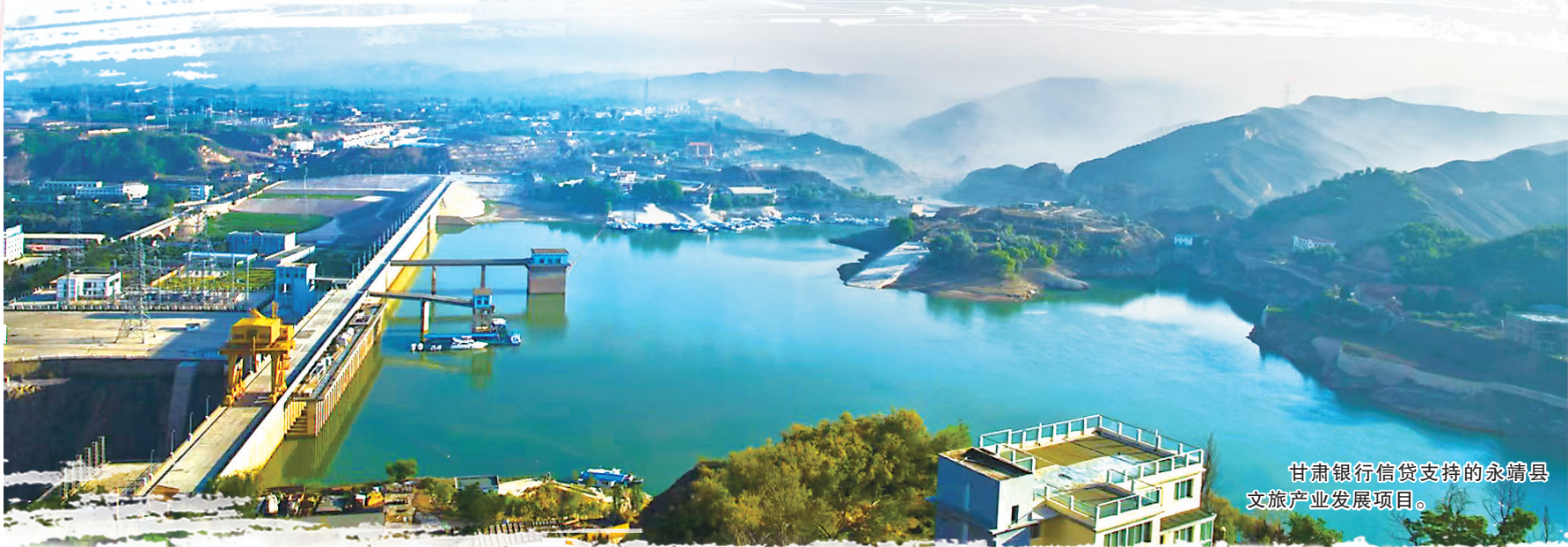
甘肃银行信贷支持的永靖县文旅产业发展项目。