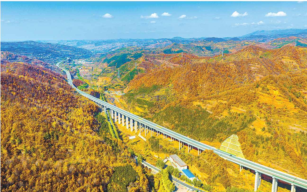
初冬时节,平凉市境内的G8513平绵高速公路掩映在层林尽染的山峦之间,美如画卷。

中央全面依法治国委员会委员,各省区市和计划单列市、新疆生产建设兵团党委全面依法治省(区、市、兵团)委员会负责同志,中央和国家机关有关部门、有关人民团体、中央军委机关有关部门负责同志等参加会议。