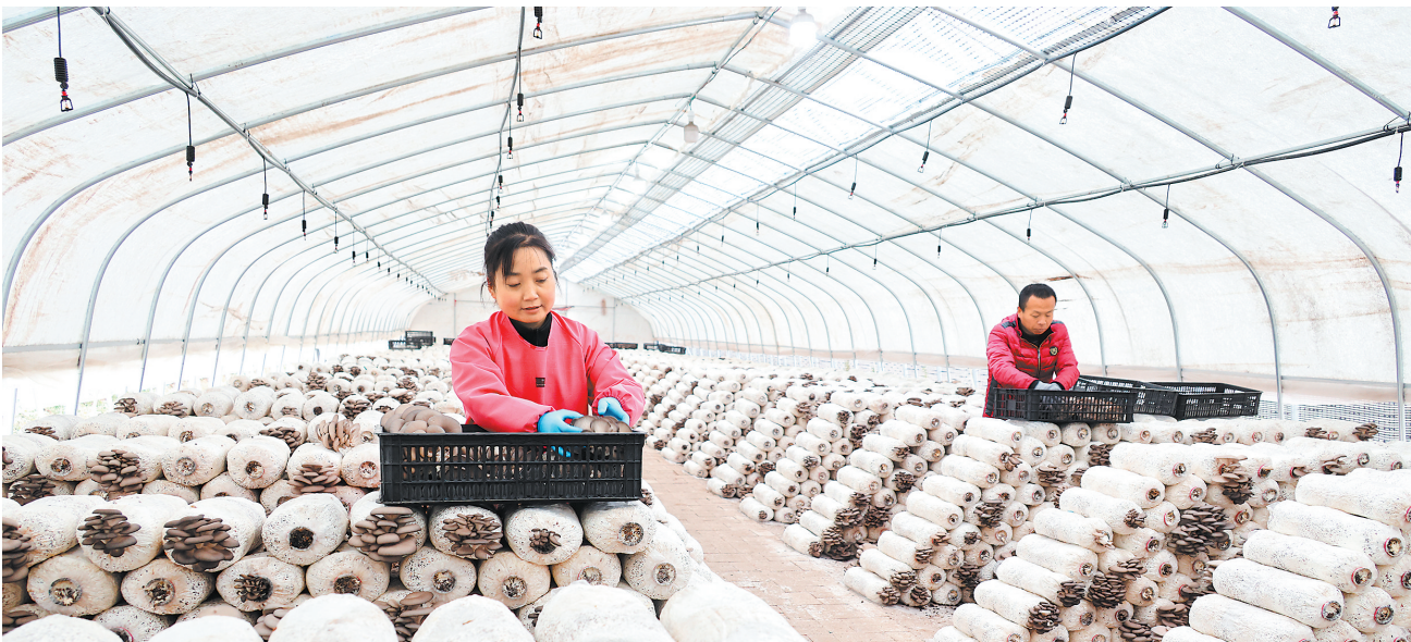
近日,在庆阳市西峰区后官寨镇食用菌种植基地,农户正在采摘平菇。