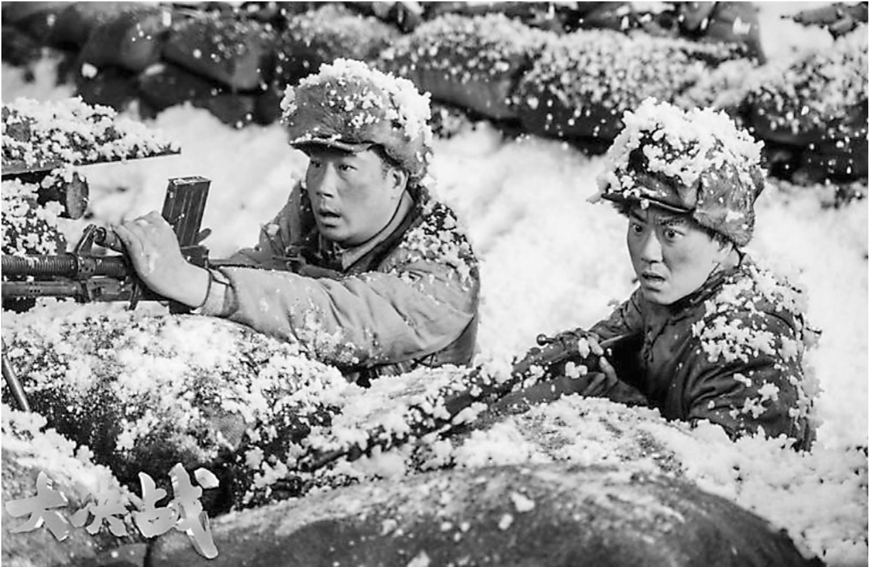
电影《大决战》之《辽沈战役》剧照

影评集以相当的篇幅深入讨论了《归来》《大决战》《丝路花雨》等具有代表性的华语电影。《归来》作为一部备受关注的电影,以其深刻的主题和动人的情感打动了众多观众。尔雅在肯