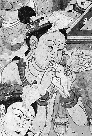
吹海螺乐伎 莫高窟第112窟 中唐