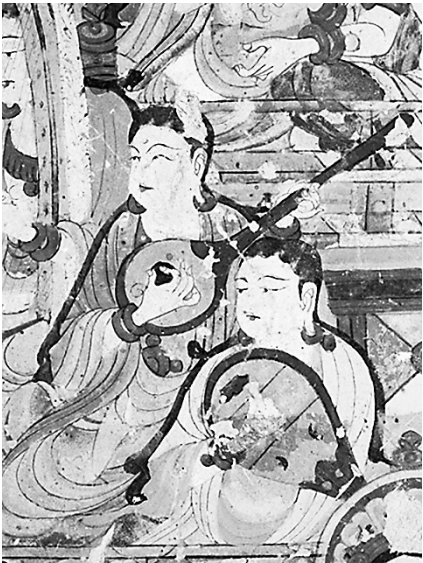
演奏琵琶和阮 莫高窟第112窟 中唐

“真正的电影艺术需要慢品,需要深思”,这句话用以说明尔雅新作《那些美好的电影》的主旨,切中肯綮。作为一部优秀的影评集,该书以独特的观察视角和深刻的艺术思考,对多部经典电影予以深度分析,探讨银幕何以承载集体记忆、折射人性光辉;其文清雅流畅,放怀寥廓,用“慢”下来的沉静生发出勃然的力量,穿透喧嚣,致敬美好。