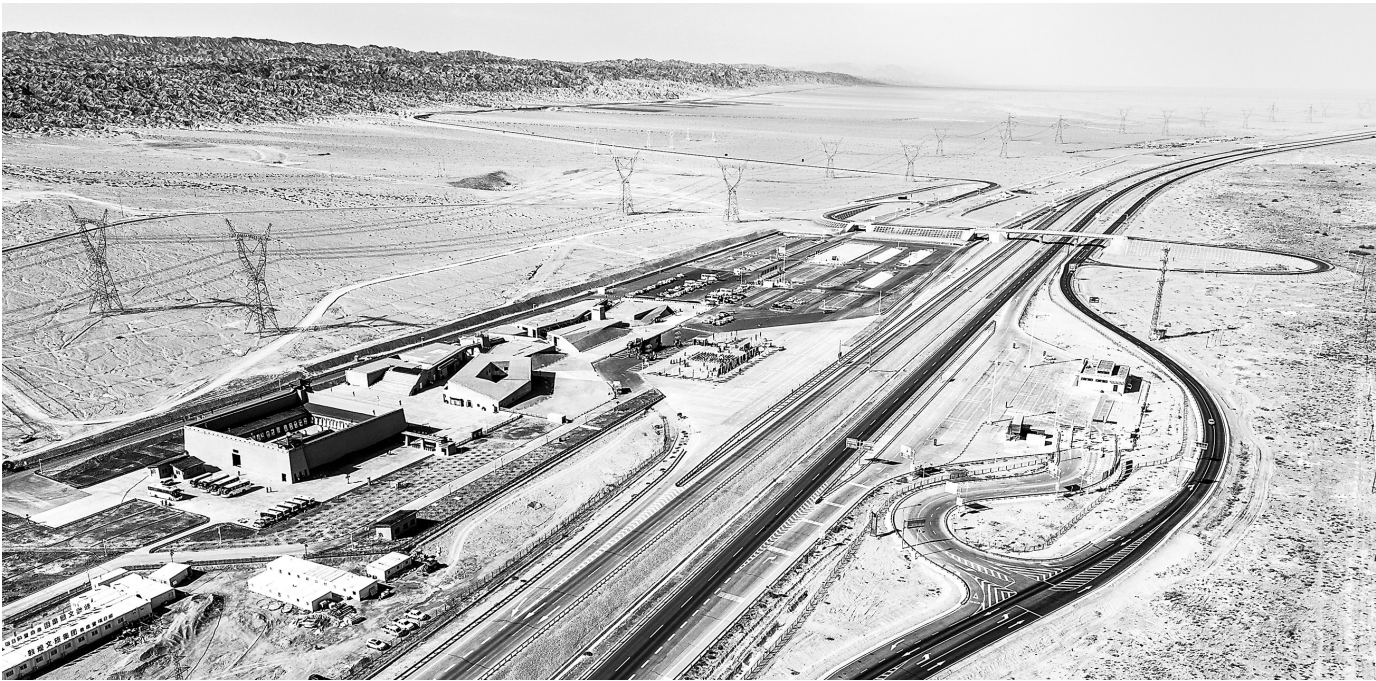
悬泉置遗址景区 郎兵兵