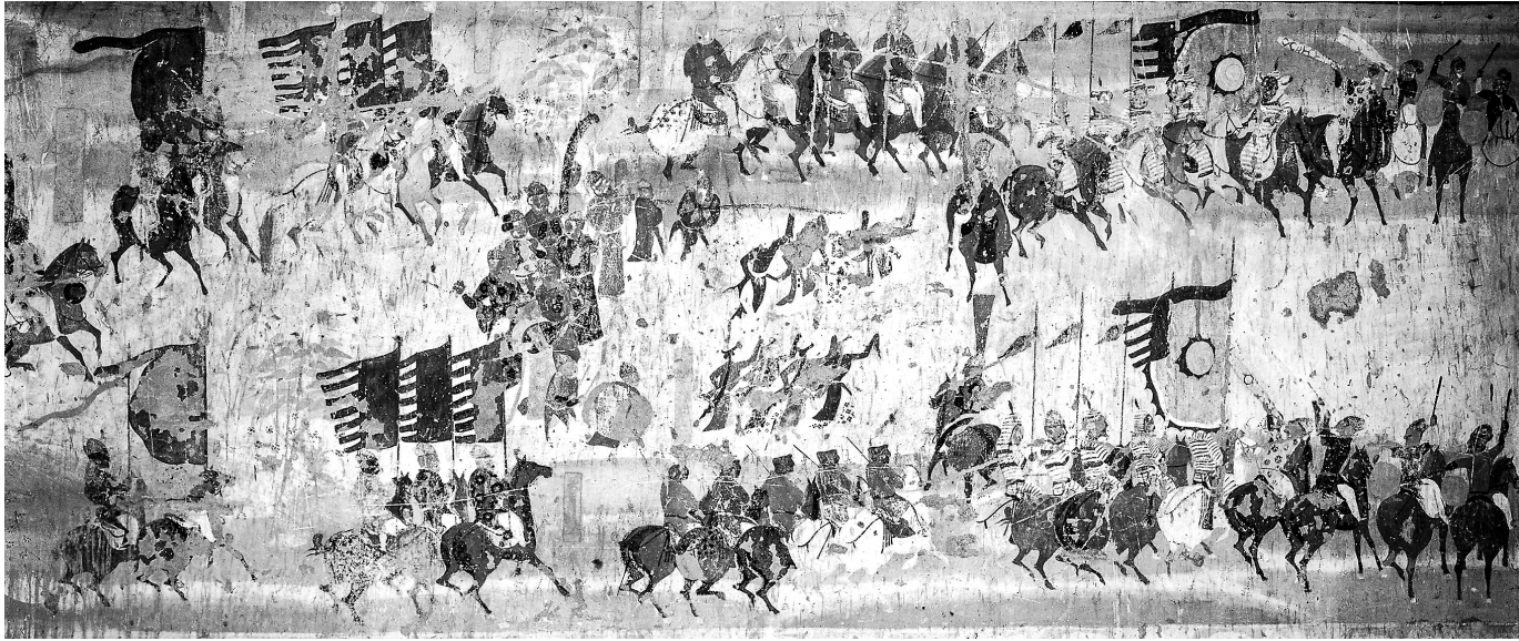
张议潮统军收复河西图 莫高窟第156窟 晚唐

2023年,《敦煌通史》问世,从宏观视角勾勒出了敦煌地区的历史全貌,对于敦煌学发展具有里程碑意义。《敦煌通史》内容丰富翔实,但篇幅宏大、字数繁多。为了方便广大读者快速了解敦煌历史与莫高窟艺术史,《敦煌通史》主编郑炳林教授集兰州大学敦煌学研究所众多学者之力,将《敦煌通史》的各部分内容进行重写与调整,并增加了有关敦煌艺术史的章节,编成一本兼具严谨学术性与通俗可读性的图书——《敦煌历史与艺术》,作者通过对两汉至明清时期敦煌地区的历史与艺术贯通性、总结性研究,展现了汉代至清代敦煌历史、敦煌艺术发展的宏大历程,是丝绸之路历史与艺术的缩影。