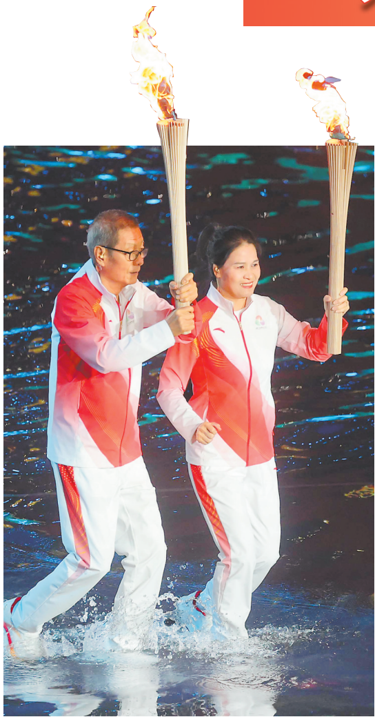
火炬手冼东妹(右)、容志行传递火炬。