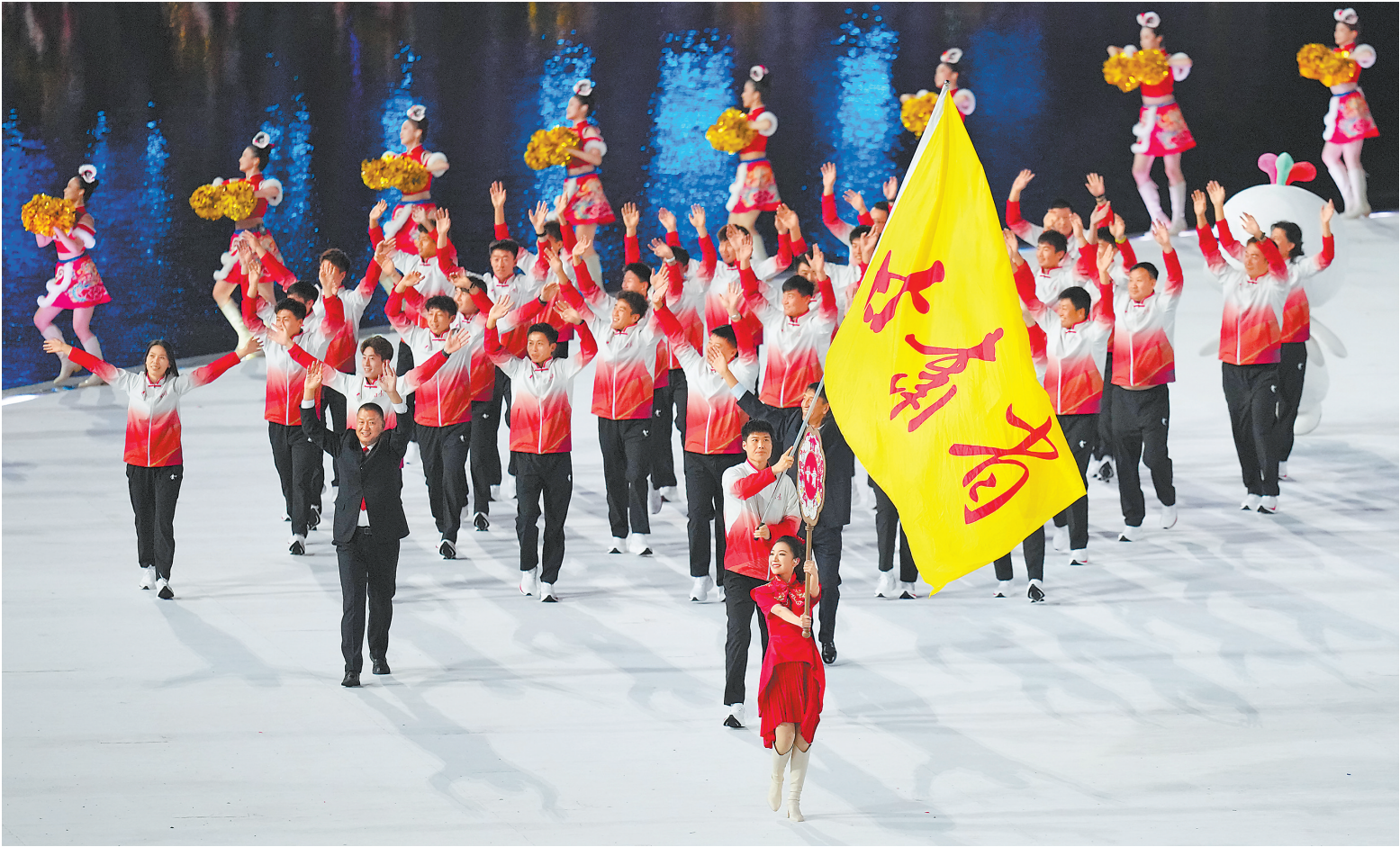
甘肃省体育代表团在入场仪式上。

热血深处见柔情。粤剧版《彩云追月》婉转响起,水面上的戏台渐次亮起——设计灵感取自广