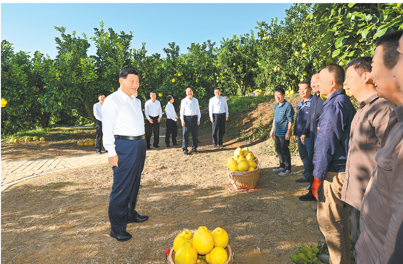
11月7日至8日,中共中央总书记、国家主席、中央军委主席习近平在广东考察。这是7日下午,习近平在梅州市梅县区雁洋镇南福金柚种植基地考察时,同果农和农技人员亲切交流。

习近平指出,学习宣传贯彻党的二十届四中全会精神,是当前和今后一个时期全党全国的一项重大政治任务。要通过多层次多渠道宣讲培训,引导广大干部群众切实把思想和行动统一到党中央决策部署上来,进一步增进共识、增强信心、增添干劲。要准确把握党中央精神,针对干部群众关注的问