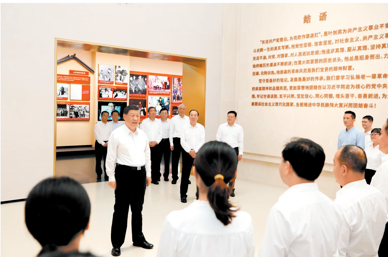
11月7日至8日,中共中央总书记、国家主席、中央军委主席习近平在广东考察。这是7日下午,习近平在位于梅州市梅县区雁洋镇的叶剑英纪念馆参观时,同工作人员亲切交流。

新华社广州11月8日电 中共中央总书记、国家主席、中央军委主席习近平近日在广东考察时强调,广东是改革开放的排头兵、先行地、实验区,要深入学习宣传贯彻党的二十届四中全会精神,科学谋划未来5年的目标、任务和举措,以全面深化改革开放推动高质量发展,久久为功推动粤港澳大湾区建设,纵深推进全面从严治党,不断取得现代化建设新成效。