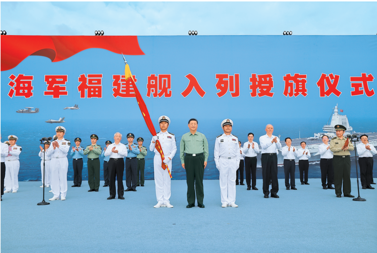
11月5日，我国第一艘电磁弹射型航空母舰福建舰入列授旗仪式在海南三亚某军港举行。中共中央总书记、国家主席、中央军委主席习近平出席入列授旗仪式并登舰视察。这是习近平向福建舰舰长、政治委员授予军旗。