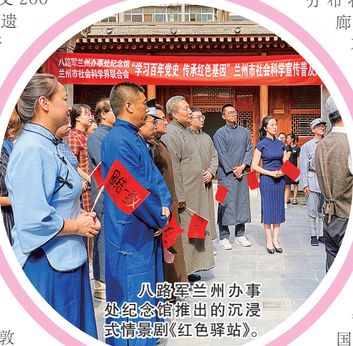
八路军兰州办事处纪念馆推出的沉浸式情景剧《红色驿站》。

五年来,文物保护提质实现新发展。资源家底更加清晰。全省首次石窟寺调查摸清219处(236个点)石窟寺分布状况,全省调查登记廊桥20处、岩画72处、不可移动革命文物617处。全面开展甘肃省第四次全国文物普查,新发现文物线索4659条,全省文物资源版图持续清晰完整。基础工作更加坚实。省政府公布第九批省保单位91处。编制实施全省长城、廊桥和14处国保单位保护专项规划。在全国率先完成152处国保单位、621处省保单位和所有市县保单位的“两线”划定公布,为依法加强文物保护提供了有力保障。国家文化公园建设加速推进。推动长城国家文化公园甘肃段建设,敦煌汉长城、嘉峪关明长城、临洮战国秦长城3个综合示范区,汉长城、明长城、战国秦长城3个集中展示带和临泽、永昌、民勤、古浪一凉州、天祝、景泰一靖远、环县、华池8个重点展示点建设稳步推进,着力构建“338”总体布局,实施长城本体保护、环境整治、展示利用等项目93项,全省长城保护利用整体水平大幅提升。加强黄河国家文化公园甘肃段建设。省文旅厅、省发展改革委、省文物局等5部门编制《甘肃省黄河文化遗产保护利用