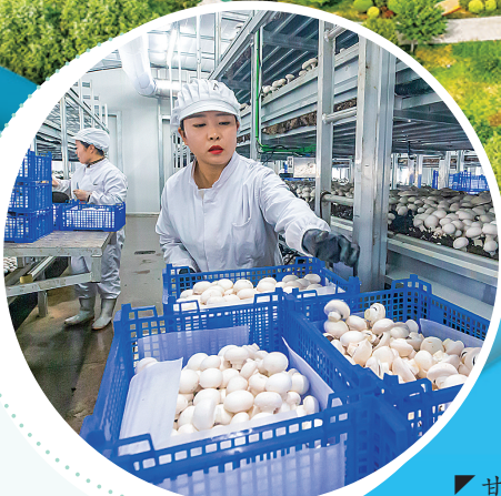
▲甘农磨力食用菌全产业链双孢菇标准化生产基地,工人采摘双孢菇。李卿