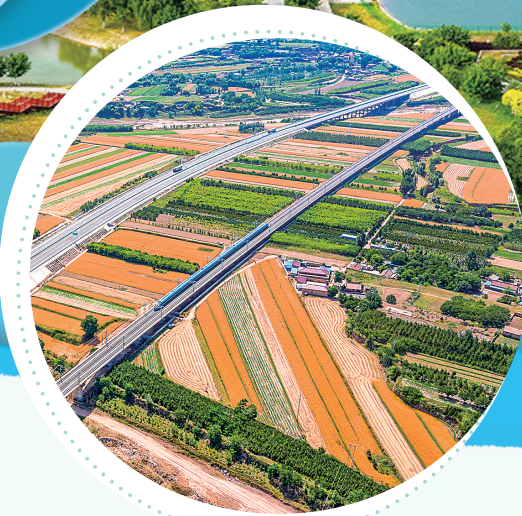
▲高铁高速横穿庆城县卅铺镇四十铺村。王世军