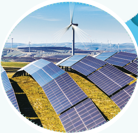
▲环县毛井镇新能源项目基地。王启宁

“十四五”以来,庆阳市坚持以习近平新时代中国特色社会主义思想为指导,全面落实省委省政府对庆阳提出的“挑大梁、作标杆”工作要求,坚持不懈抓项目、扩投资、兴产业,经济社会发展取得长足进步,中国式现代化庆阳实践迈出坚实步伐。