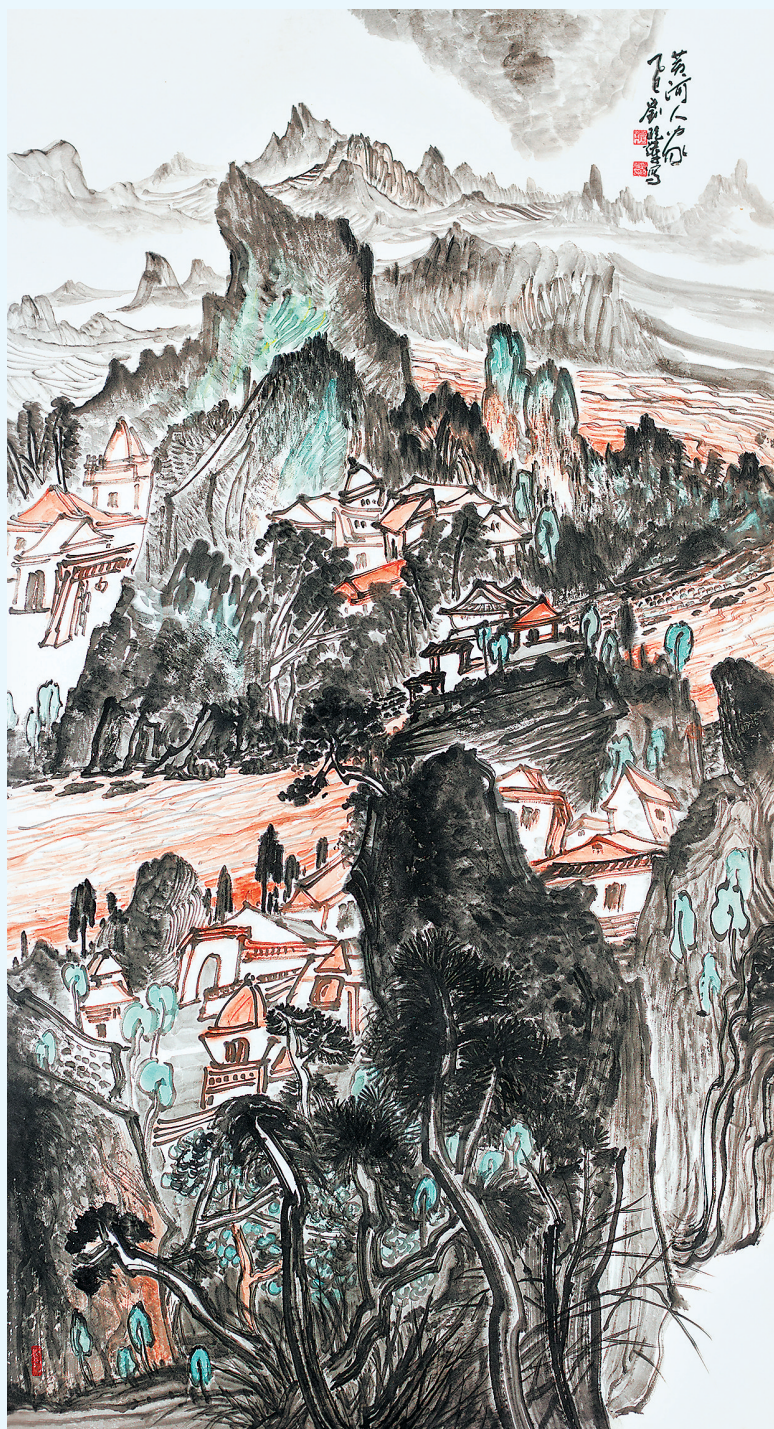
黄河人家(中国画)刘晓辉