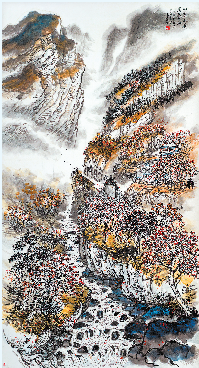
山高水长万壑红(中国画)杜喜俊