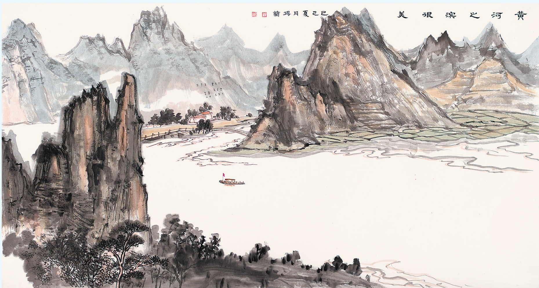
黄河之滨很美(中国画)王得兰

陇原大地,钟灵毓秀。从麦积山的石窟灵韵到敦煌的飞天流彩,从河西走廊的戈壁苍茫到扎尕那的秘境叠翠,甘肃的每一寸土地都沉淀着千年文明的厚重,每一处景致都流淌着自然与人文交织的诗意。