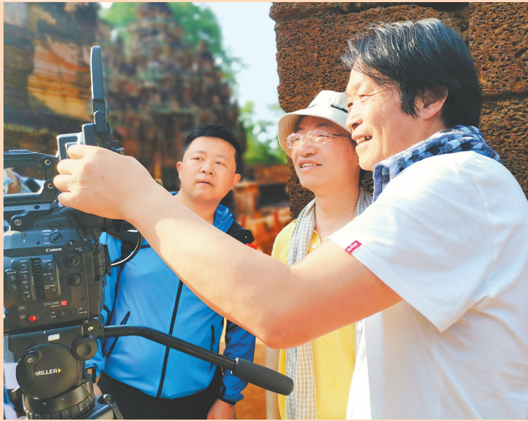
《莫高窟与吴哥窟的对话》拍摄现场