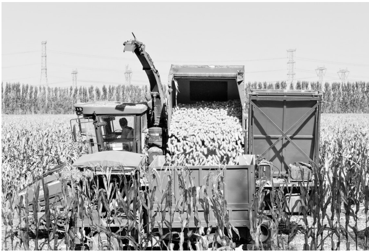
10月21日，收割机在天津市蓟州区下窝头镇收获玉米。

从田园村寨的“共富约定”到城市社区的“共乐准则”，111份修订完善的村规民约与居民公约，串联起西固区基层治理的“主线”，正成为西固区基层治理的“金钥匙”。下一步，西固区将建立公约“践行—评估—优化”闭环机制，让“新约定”持续焕发活力，以铸牢中华民族共同体意识畅通基层治理“神经末梢”，为巩固全国民族团结进步示范区创建成果注入基层力量。 （西固区委统战部）