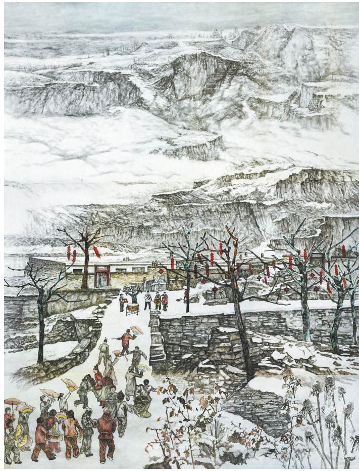
祥和冬日(中国画) 王慧子