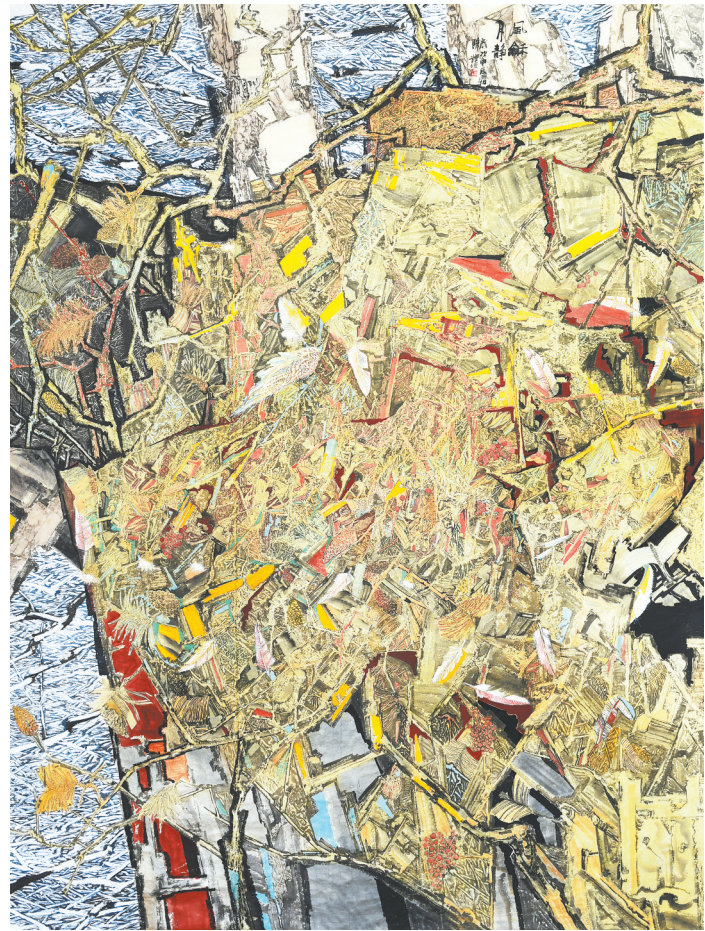
风和月静(中国画) 张发俭