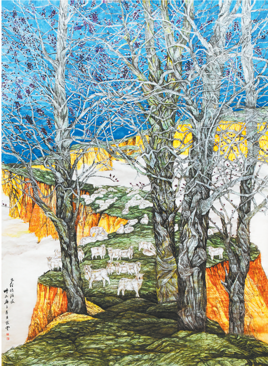
绿荫长(中国画) 买武堂