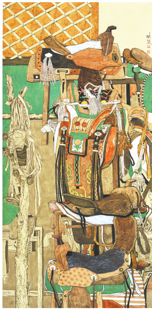
草原风情(中国画) 李晓琴