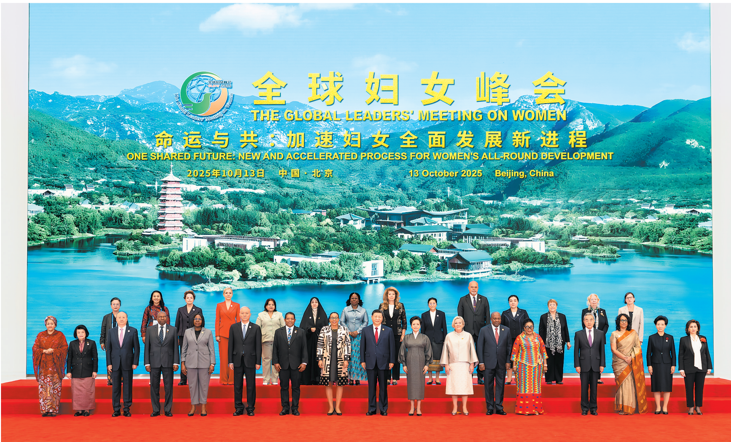
10月13日上午,国家主席习近平在北京国家会议中心出席全球妇女峰会开幕式并发表主旨讲话。这是习近平和夫人彭丽媛与会各国和国际组织代表团团长夫妇合影留念。

新华社北京10月13日电(记者马卓言董博婷)10月13日上午,国家主席习近平在北京国家会议中心出席全球妇女峰会开幕式并发表主旨讲话。